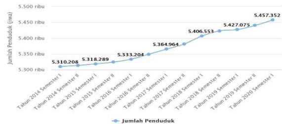
Grafik Pertambahan Penduduk Per Semester Provinsi Kalimantan Barat

Dari pemaparan latar belakang di atas, maka menjadi sangat penting untuk diadakan suatu penelitian tentang nilai atau sikap moderasi dan toleransi antar umat beragama dalam menjaga keutuhan di Kota Pontianak Kalimantan Barat. Karena Kalimantan barat memiliki penduduk 5.457.352 jiwa. Menganut berbagai macam agama sebagaimana table di bawah ini: 24