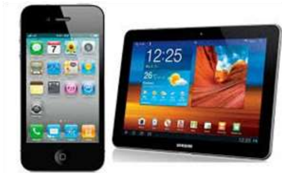
Gambar 1. Smartphone dan tablet Android

Android adalah produk berupa sistem operasi yang dikembangkan dari sistem operasi Linux oleh Android Inc. Pada tahun 2005 Google membeli sistem operasi Android untuk sistem operasi perangkat computer berbasis palmtop atau yang dikenal telepon cerdas (smartphone). Berikutnya pada tahun 2007 dibentuk Open Handset Alliance (OHA) yang mana Google bekerjasama dengan perusahaan elektronik ternama seperti Texas Instruments, Broadcom Corporation, HTC, Intel, LG, Marvell Technology Group, Motorola, Nvidia, Qualcomm, Samsung Electronics, Sprint Nextel, T-Mobile dan beberapa perusahaan lainnya. Kolaborasi ini bertujuan untuk pengembangan standar terbuka untuk sistem perangkat mobile [3].