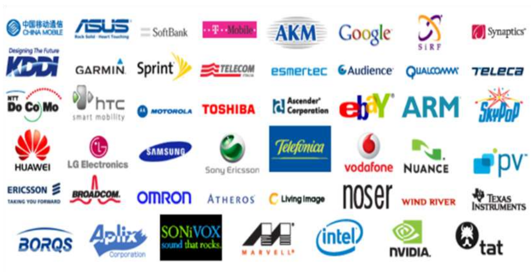
Gambar 2. Perusahaan-perusahaan yang tergabung dalam OHA