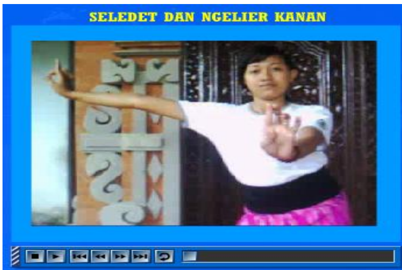
Gambar 5. Tampilan Menu Gerakan Tandang (Seledet dan Ngelier Kanan)