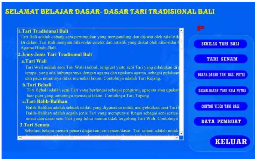
Gambar 2. Tampilan Menu Utama Multimedia Gerakan Dasar Tari Bali