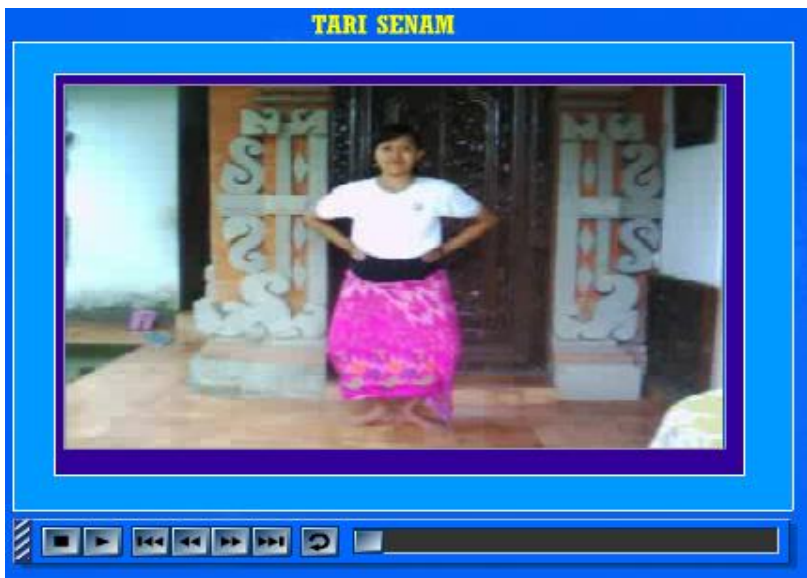
Gambar 3. Tampilan Menu Gerakan Tari Senam