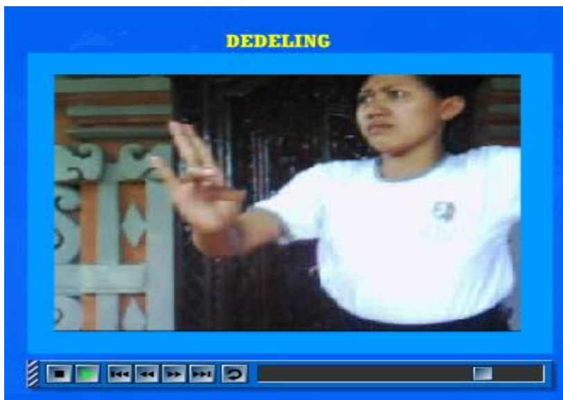
Gambar 6. Tampilan Menu Gerakan Tangkep (Dedeling)