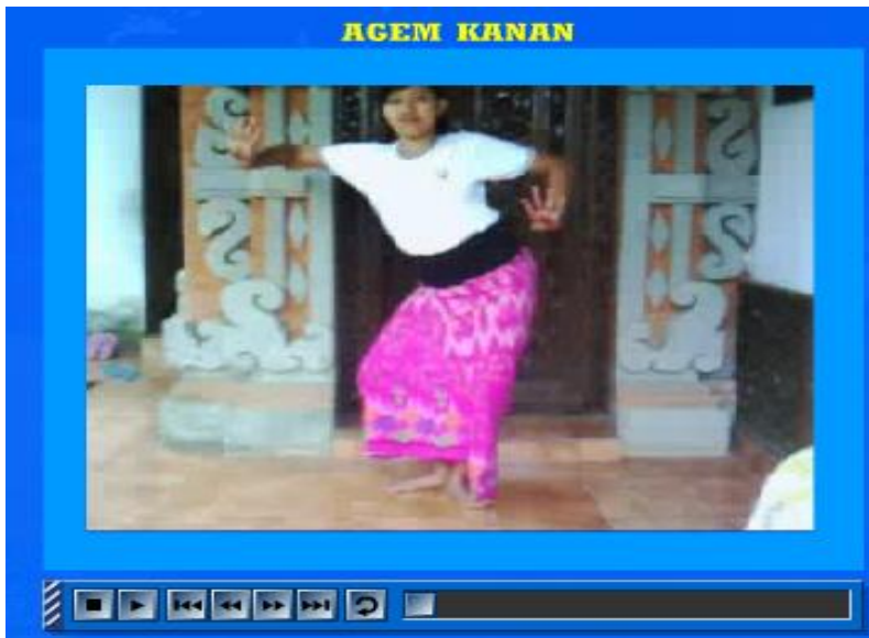
Gambar 4. Tampilan Menu Gerakan Agem Kanan