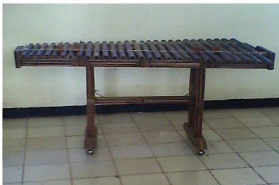
Gambar 5. Carumba (Dokumentasi: Burhan, 2009)

berbagai oktaf, dengan maksud 2 set untuk memainkan variasi atau isian ( fill ) dan 2 set lagi menjadi pengiring ( rhythm ), atau bisa juga sebagai pembawa lagu bergantian dengan angklung melodi. Arumba melodi (variasi/improvisasi) juga terdiri dari 2 set, susunan nadanya terdiri dari: e oktaf kecil sampai dengan a" sebanyak 30 tabung untuk Carumba melodi 1 dan B oktaf besar sampai dengan fis" sebanyak 32 tabung untuk Arumba melodi.