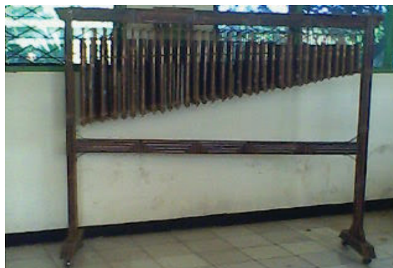
Gambar 4. Angklung melodi

Jumlah Carumba dalam sebuah ensambel Arumba biasanya berjumlah 4 set dalam