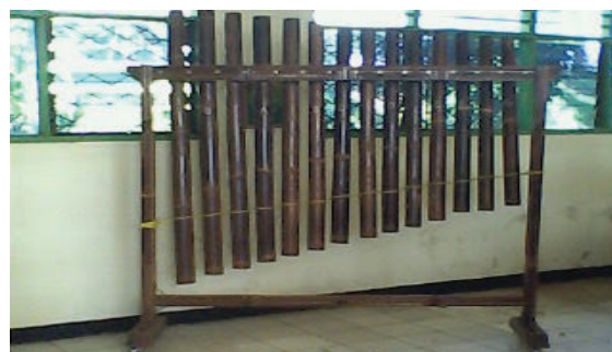
Gambar 6. Bass Lodong

Dari modul yang pernah disusun oleh Burhan sejak dia bekerja di Dinas Pariwisata DKI Jakarta dipaparkan bahwa pada dasarnya terdapat perlakuan sedikit berbeda dalam memainkan alat-alat musik Arumba. Hal itu dikarenakan seluruh alat-alat musik Arumba tersebut terbuat dari bahan bambu. Secara prinsip teknik-teknik