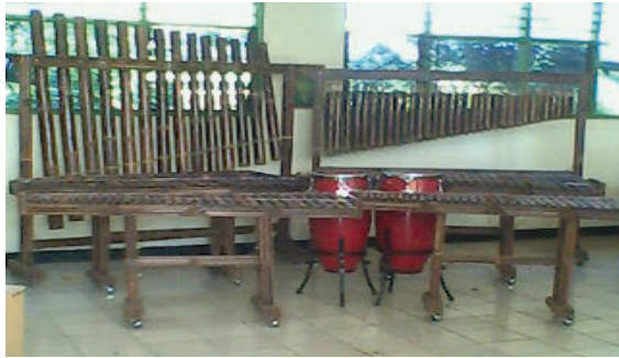
Gambar 7. Satu Unit Arumba