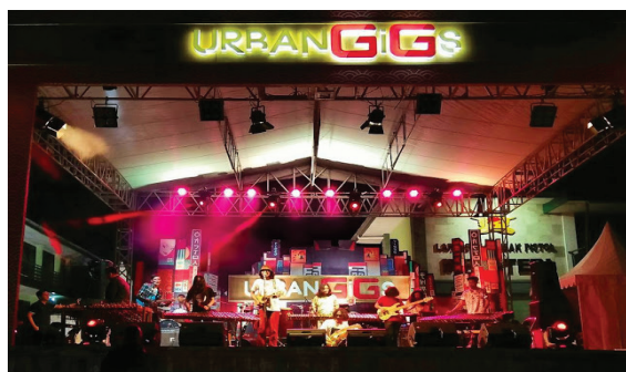
Gambar 10. Gaya Kostum kasual Paberik Bambu