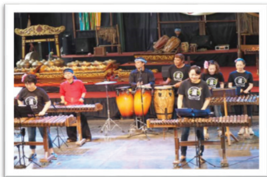
Gambar 9. Penyajian Grup Arumba Buluh Perindu di Saung Angklung Udjo

Dengan kata lain, masyarakat, atau lebih tepatnya anak muda, lebih berorientasi pada perpaduan musik yang lebih modern dengan tujuan ingin lebih merangkul anak muda lainnya agar menyukai dan memberikan perhatian lebih bagi musik Arumba. Dari perkembangan tersebut, dapat dilihat bahwa jumlah personil (pemain) tentunya sangat ditentukan dari konsep musik yang diusung oleh grup musik Arumba yang dimaksud.