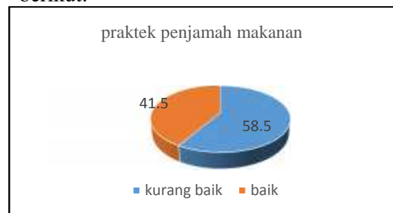
Gambar 2. Distribusi praktek penjamah makanan jajanan di sekitar sekolah dasar kota Tasikmalaya

Gambaran mengenai praktek penjamah pada pedagang jajanan makanan di sekitar sekolah dasar kota Tasikmalaya dapat dilihat pada grafik berikut: