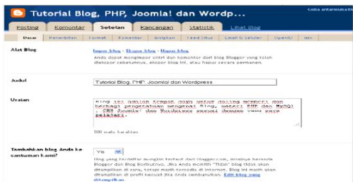
Gambar 4. Tampilan Setting Blog di Blogger