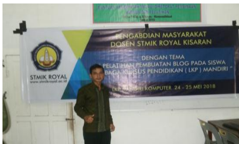
Gambar 5. Persiapan Kegiatan