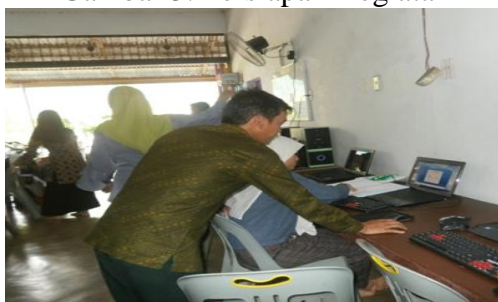
Gambar 6. Praktek Membuat Blog