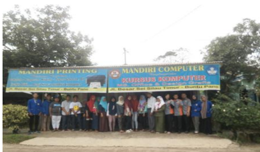
Gambar 7. Foto Bersama Para Dosen dan Siswa LKP Mandiri

membuat blog. Materi yang disampaikan kepada peserta mencapai 90% dari semua konsep yang ada pada pembuatan blog. Penyampaian materi terdiri dari beberapa sesi, yaitu: penjelasan, praktek, dan diskusi. Fasilitas yang disediakan oleh pimpinan Lembaga Kursus Pendidikan Mandiri Komputer sangat lengkap, mulai dari projector, in focus, mikrofon, kipas angin, dan lain-lain, sehingga situasi dan keadaan ruangan sangat nyaman dan aman.