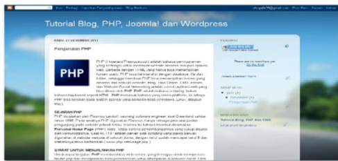
Gambar 3. Tampilan Blog di Blogger

Anda sudah langsung masuk ke halaman Admin Blog / Dasbor. Anda dapat langsung mencoba mengisi artikel yang anda inginkan dengan mengetikkan judul dan artikel anda. Contoh tampilan pengisian / posting artikel. Klik Terbitkan entri. Dan berikut adalah tampilan dari blog anda.