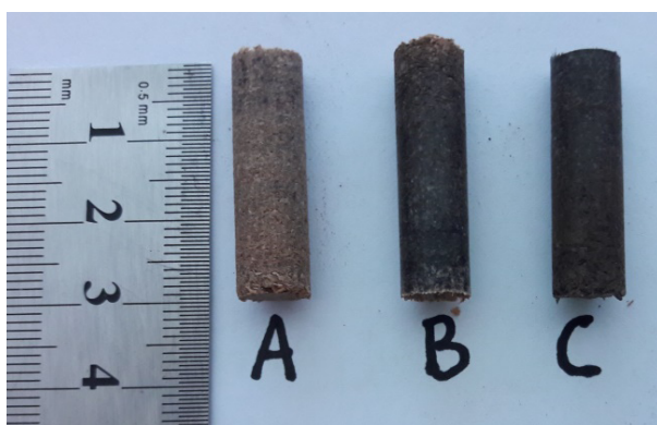
Gambar 3. Pelet kayu jabon: A (kondisi kering udara), B (kadar air 15%), dan C (kadar air 20%)

Nilai densitas dan ketahanan pakai dari pelet kayu yang dihasilkan memenuhi standar ISO 17225-2 untuk kelas A1 dan A2, kecuali pada pelet kayu ketapang pada kadar air kering udara. Nilai ketahanan pakai yang diperoleh pada pelet kayu ketapang pada kadar air kering udara adalah 94,93%, sedangkan standar minimal ketahanan pakai adalah 96,5%. Akan tetapi, menurut Miranda et al. (2015), secara umum ketahanan pakai dan densitas pelet yang dibuat dalam skala laboratorium memang rendah atau tidak memenuhi persyaratan dikarenakan keterbatasan alat yang digunakan dalam percobaan di laboratorium, meskipun demikian hal ini tidak menjadi kendala utama dalam produksi di pabrik karena permasalahan yang muncul biasanya dikarenakan tingginya kandungan abu pada pelet.