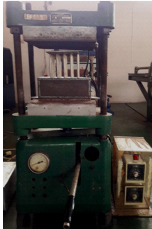
Gambar 2. Mesin press hidrolik Figure 2. Hydraulic press machine

h. Pengujian emisi Nitrogen (N), Sulfur (S), dan Klorin ( Cl_2 )