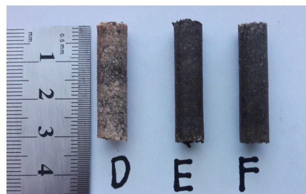
Gambar 4. Pelet kayu ketapang: D (kondisi kering udara), E (kadar air 15%), dan F (kadar air 20%)