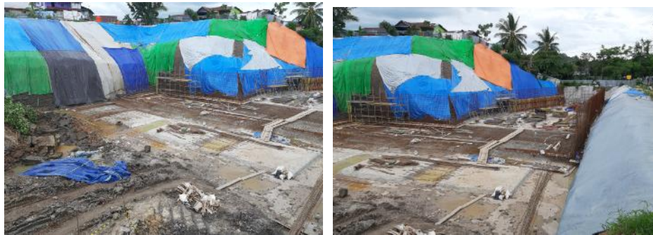
Gambar. 1 Kondisi visual galian bangunan reservoir

Permasalahan yang dihadapi adalah masalah kesulitan pemasangan struktur dinding pelindung lereng, karena kondisi lereng yang curam dan kondisi lahan yang terbatas. Faktor penyebab permasalahan adalah faktor material, yakni kondisi lereng yang curam dan spesifikasi material tanah lempung berwarna abu-abu kehitaman dan tekstur halus yang rapuh dan mudah menjadi bubuk jika terkena air hujan (Sulardi, Agus Sugianto, 2018). Terhadap permasalahan tersebut telah pula dilakukan pengendalian dengan menutup lereng dengan terpal untuk mencegah pelunakan dan kelongsoran tanah lereng oleh air hujan. Pada bagian sisi atas lereng ditutup dengan selapis tipis beton ringan untuk mencegah perembesan air hujan dan dilakukan pemasangan manual inklinator untuk memonitor pergerakan lereng (Sulardi, 2016). Namun hal tersebut tidak menyelesaikan permasalahan karena secara parsial masih terjadi keruntuhan serpihan-serpihan tanah lereng sehingga dikawatirkan akan terjadi keruntuhan lereng secara masal apabila tidak dilakukan proteksi lereng dengan segera.