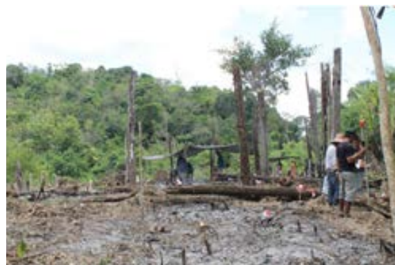
Foto 2. Situs Bataguh, dengan susunan kayu ulin bekas tiang

Serupa dengan di wilayah hulu, daerah tengah dan hilir Kahayan memiliki tinggalan