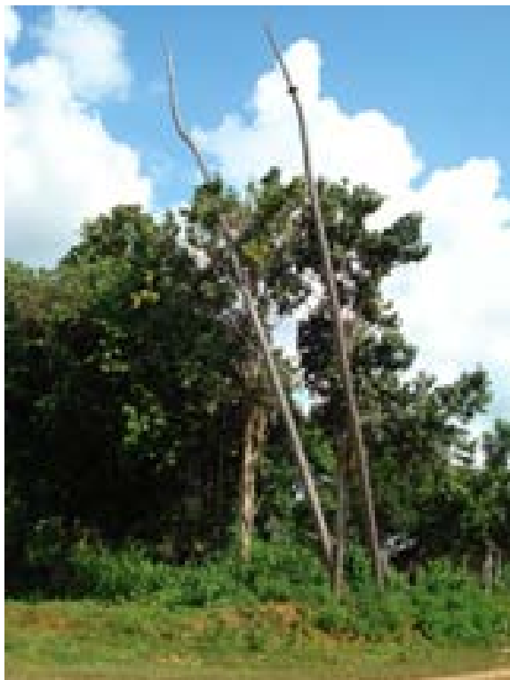
Foto 1 Tiang pantar Desa Pandau di Arut Utara

yang merupakan bagian dari Dayak Ngaju. Religi dan tradisi Kaharingan masih dijumpai pada beberapa tinggalan arkeologi, yaitu tiang pantar (gambar 1) dan sempunduk (Hartatik 2009a: 101-