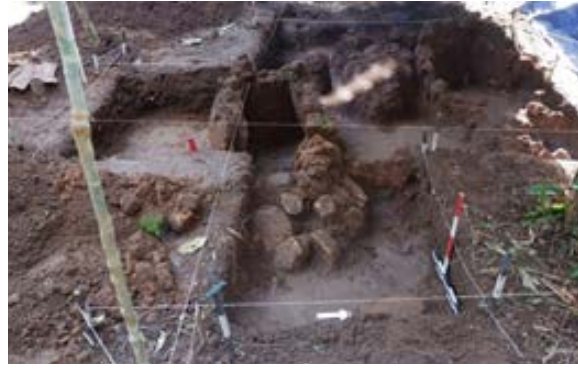
Foto 4. Tungku peleburan besi (buren benangin) di Desa Pelari

Lakak, dan Liang Keriwa yang menjadi permukiman Dayak Bawo saat ini; dan situs Jasuang, Patas 1, Tempongan Ussang, dan Bipakali Lama yang menjadi permukiman Dayak Lawangan saat ini (Hartatik 2009b: 10-16; Wasita 2006: 6). Kedua kelompok situs tersebut berada di Kecamatan Gunung Bintang Awai, Barito Selatan. Penguburan dalam gua ini merupakan bentuk kubur sekunder di mana tulang dan tengkorak manusia disimpan secara komunal pada peti kubur kayu yang disebut raung dan tabela . Keberadaan ceruk/gua kubur ini umumnya jauh dari lokasi pemukiman warga saat ini. Ceruk dan gua juga terletak pada lereng-lereng bukit karst yang cukup terjal dan cenderung susah dijangkau.