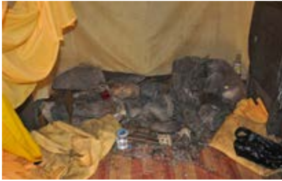
Foto 3. Keramat batu (pangantuhu) di Sei Basirih di Kapuas Hilir (dok. Balar Kalsel 2011; Sunarningsih 2012: 39)