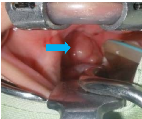
Gambar 1. Inspeksi tumor sesaat sebelum operasi.

Tindakan selanjutnya dilakukan ekstirpasi tumor trans-oral dengan anestesi umum. Dilakukan insisi 2 mm pada tepi arkus anterior mulai pole atas sampai setinggi batas bawah tumor, diseksi tumor dari perlengketan di fossa tonsilaris, tumor dapat dikeluarkan in toto, tampak tumor permukaannya licin, tidak mudah berdarah, konsistensi kenyal, ukuran 2x1x0,5 cm.