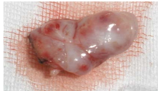
Gambar 3. Tampak tumor intoto dengan ukuran 2x1x0,5 cm.

Pascaoperasi anak dalam keadaan baik, dengan pemberian antibiotik dan analgetik selama rawat inap. Anak dipulangkan hari ke-3, kemudian datang kontrol di poli rawat jalan dengan keadaan baik dan sudah tidak lagi tidur mendengkur, sesak atau regurgitasi. Anak kuat minum. Tampak mukosa orofaring normal dan hasil pemeriksaan patologi anatomi adenoma pleomorfik.