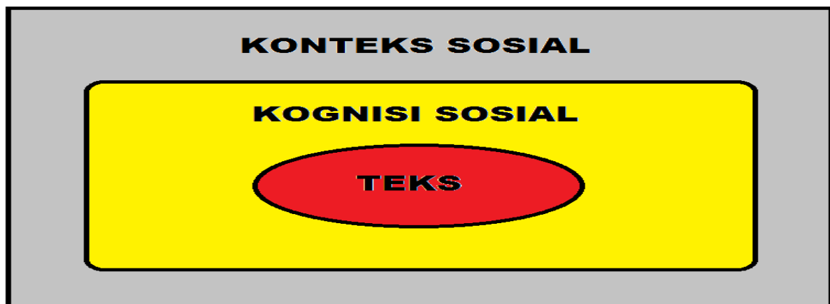
Gambar 1. Model Analisis Wacana

wacana dipakai untuk menegaskan suatu tema tertentu adalah hal yang akan diteliti. Kognisi sosial mempelajari proses induksi teks berita yang melibatkan kognisi individu dari penulis dalam hal ini Ridwan Kamil. Sedangkan aspek ketiga yaitu kritik sosial yang mempelajari bangunan wacana yang berkembang dalam masyarakat akan suatu masalah. Model analisis van Dijk ini bisa digambarkan sebagai berikut: