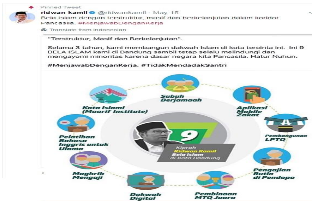
Gambar 3 Tweet Pertama Ridwan Kamil

peneliti kategorikan sebagai titik awal oleh Ridwan Kamil dalam melakukan jawaban atas banyaknya respon negatif yang masuk ke dalam timeline akun twitter miliknya. Ada 10 tweet yang peneliti pilih dalam penelitian ini, termasuk tweet pertamanya berikut ini.