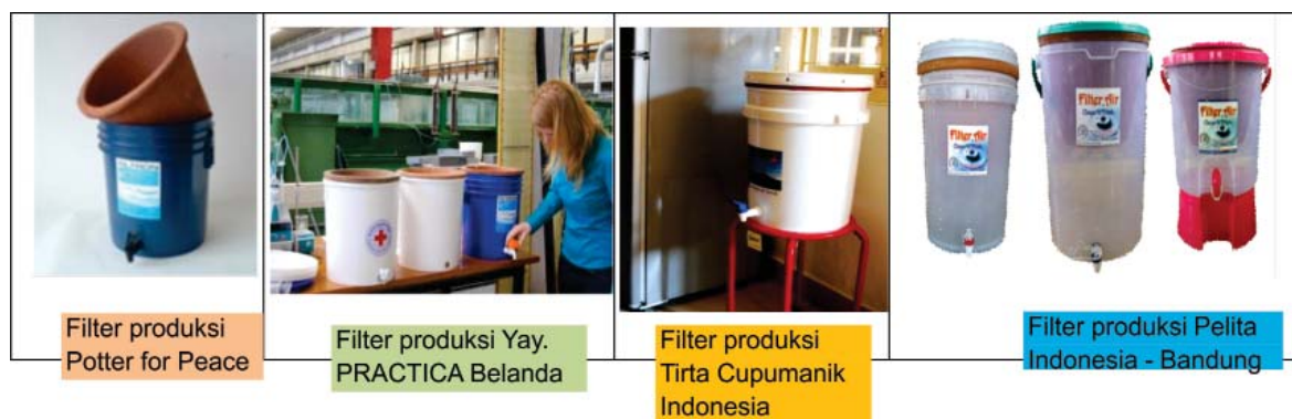
Gambar 1. Filter keramik di beberapa Negara

Kajian yang dilakukan oleh lembaga SHEEP saat ini fokus pada desain saringan keramik yang meliputi, komposisi campuran, tekanan pengepresan, porositas yang terbentuk, dan flow rate , sedangkan untuk penelitian terkait dosis dan aplikasi metode penambahan perak ke dalam saringan belum dilakukan. Berdasar pada uraian diatas maka, peneliti tertarik untuk melakukan kajian terhadap aplikasi perak nitrat ( \text{AgNO}_3 ) pada saringan keramik. Penelitian tentang efek bakterisida perak terhadap bakteri telah banyak dilakukan, namun untuk penelitian yang mengkaji mengenai dosis, dan metode penambahan perak ke dalam saringan keramik untuk mendapatkan hasil yang paling efektif dalam menurunkan E. Coli belum dilakukan.