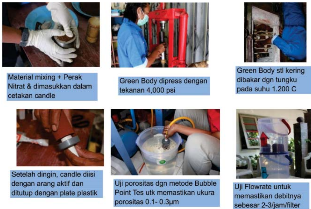
Gambar 3. Proses Pembuatan Filter Keramik

Proses selanjutnya adalah penyaringan penyaringan. Adapun hasil penyaringan dapat menggunakan air sumur, dan diamati sekaligus dilihat pada tabel berikut: pada saat penyaringan adalah volume dan waktu