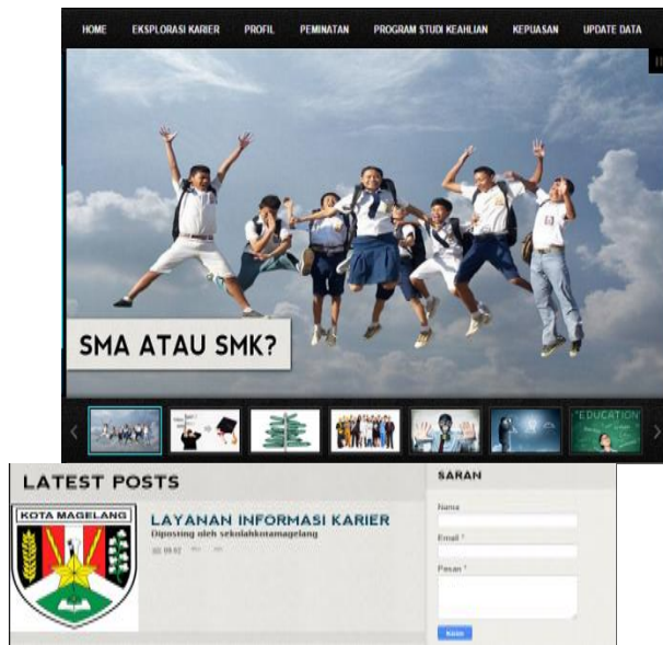
Gambar 2. Desain Informasi Karier Berbasis Media Blog