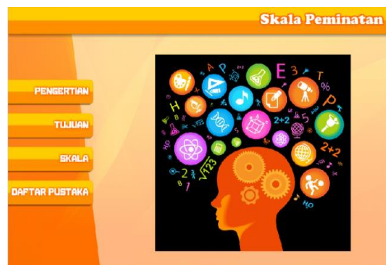
Gambar 3. Desain Skala Peminatan

Uji pengembangan produk awal kepada ahli media dan materi serta praktisi. Hasil uji pengembangan produk awal ahli media diketahui skor 42 dalam kategori Sangat Sesuai/ Sangat Baik/ Sangat Tepat. Ahli materi dengan skor 30 dalam kategori Sesuai/ Baik/ Tepat. Berdasarkan data kuantitatif menggunakan lembar evaluasi dari uji ahli media dan materi maka dapat dilanjutkan uji praktisi.