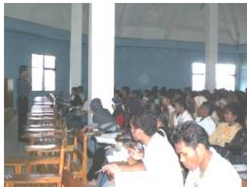
Gambar 2. Suasana Perkuliahan Kewirausahaan Agribisnis