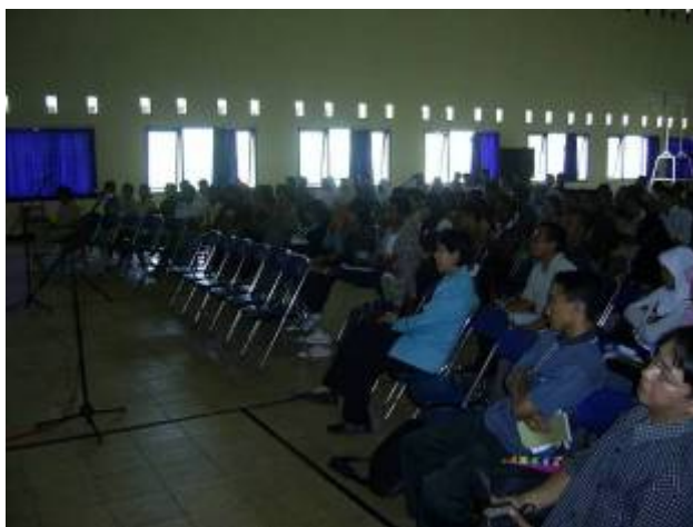
Gambar 6. Animo mahasiswa maupun staf pengajar dalam kegiatan kewirausahaan