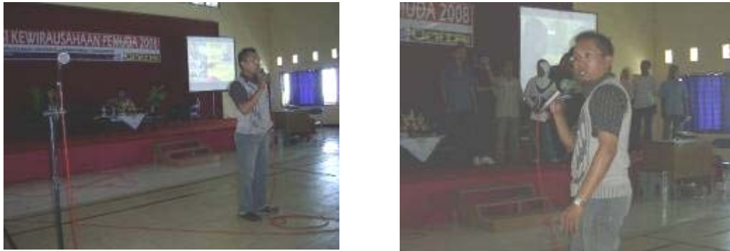
Gambar 3. Suasana Inisiasi Kewirausahaan sebagai salah satu bagian kegiatan (salahsatu sesi inisiasi yang menghadirkan motivator nasional Aldi Menzu).