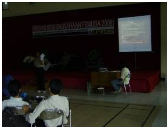
Gambar 5. Presentasi Bisnis Plan terpilih dan berdiskusi dengan sesama mahasiswa maupun dengan wirausahawan yang telah berhasil membangun rasa percaya diri