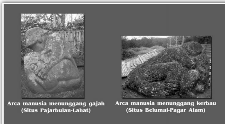
Gambar 4. Arca manusia menunggang Gajah dan Kerbau (dokumentasi Balai Arkeologi Palembang)

Salah satu ciri budaya penutur Austronesia yang lain adalah pembuatan beliung persegi dan gerabah, ada pendapat bahwa kehadiran beliung persegi merupakan indikasi adanya subsistensi pertanian, kemungkinan lain juga digunakan dalam pengerjaan kayu (Noerwidi, 2007:9). Situs Muara Payang di Kabupaten Lahat merupakan gambaran dari penghunian pemukiman dalam waktu yang lama, karena ditemukan benda-benda megalit, seperti jajaran batu yang disusun ( tetralith ), kursi batu, batu monolith dan dolmen, juga ditemukan teknologi gerabah yang digunakan sebagai tempayan kubur, dan di dalam tempayan kubur tersebut ditemukan kerangka yang diperkirakan berusia 35 tahun dari Ras Mongoloid, dan juga ditemukan beliung persegi di sekitar situs penguburan (Indiastuti, 2003:4-20; Bonatz, 2009:59).