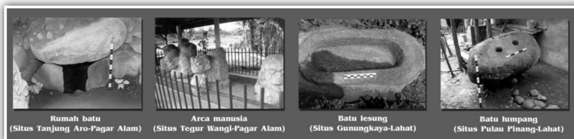
Gambar 3. Beberapa tinggalan megalit di wilayah Pasemah

Menurut hasil penelitian arkeologi yang telah dilakukan, tradisi megalitik sebagai bentuk usaha mendekatkan diri kepada arwah nenek moyang yaitu untuk peribadatan dan penguburan. Peninggalan megalitik juga tidak hanya berkaitan dengan kebutuhan yang bersifat sakral, namun juga berhubungan dengan kebutuhan sehari-hari. Misalnya saja batu-batu tegak digunakan sebagai batas kampung, susunan batu-batu besar untuk persawahan, batu lumpang untuk menumbuk biji-bijian dan lain-lain (Sukendar, 1996/1997:1-2).