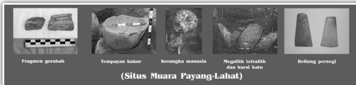
Gambar 5. Temuan artefak dan kerangka manusia di Situs Muara Payang