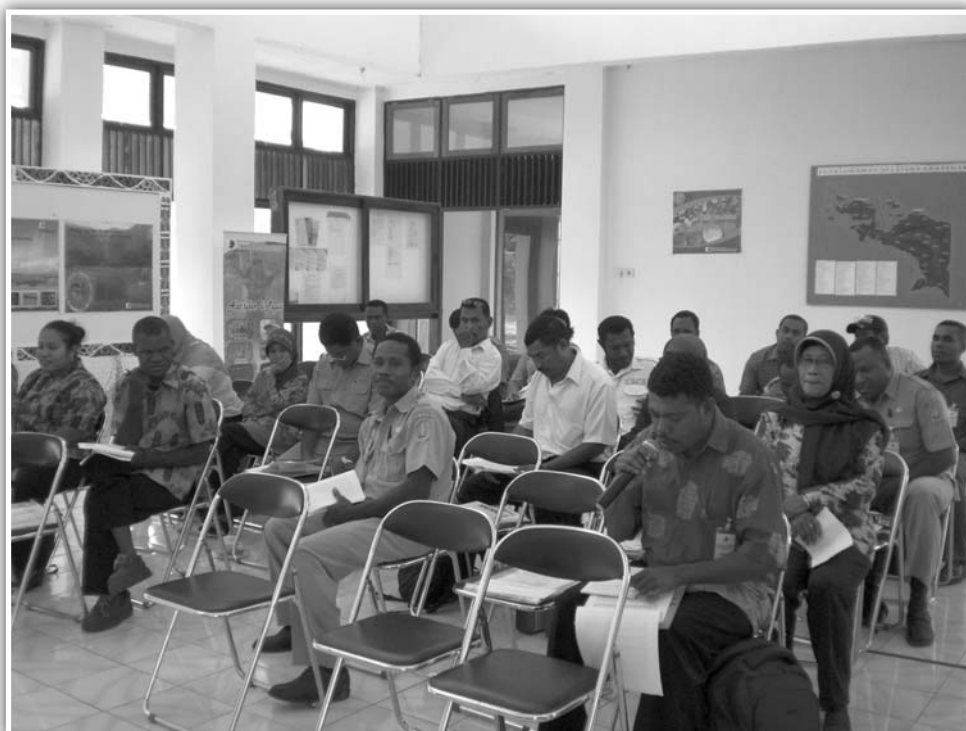
Peserta Seminar Arkeologi 2010