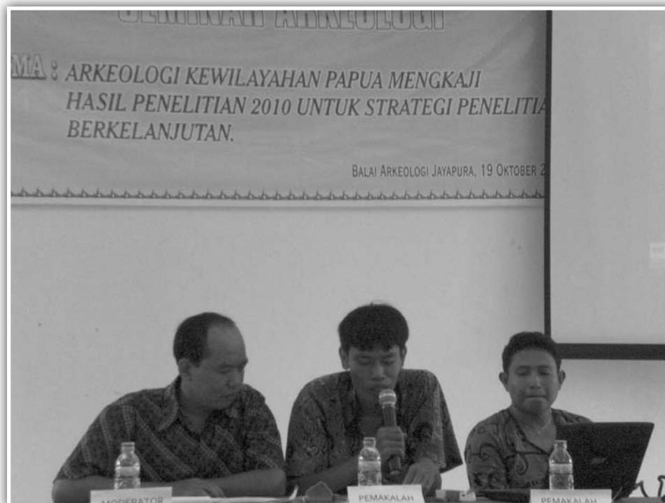
Pemaparan Materi oleh Peneliti Balai Arkeologi Jayapura

Seminar Arkeologi bertema “Arkeologi Kewilayahan Papua Mengkaji Hasil Penelitian 2010 Untuk Strategi Penelitian Berkelanjutan”. Kegiatan ini berlangsung pada 19 Oktober 2010 di Aula Balai Arkeologi Jayapura. Kegiatan ini diikuti oleh Dinas Kebudayaan dan Pariwisata (Disbudpar) Provinsi Papua, Disbudpar Kabupaten Jayapura, Disbudpar Kabupaten Jayapura, Disbudpar Kota Jayapura, Badan Perencanaan Pembangunan Daerah (Bappeda) Provinsi Papua, Bappeda Kabupaten Jayapura, Badan Penelitian dan Pengembangan Daerah Kabupaten Jayapura, Jurusan sejarah FKIP Universitas Cenderawasih, Balai Bahasa Jayapura, Balai Pelestarian Sejarah dan Nilai Tradisional Jayapura, Museum Negeri Papua, LKBN ANTARA, Harian Cenderawasih Post, TVRI, dan Papua TV. Bentuk kegiatan berupa pemaparan dari pemakalah. Panitia setelah selesai acara, melakukan konferensi pers.