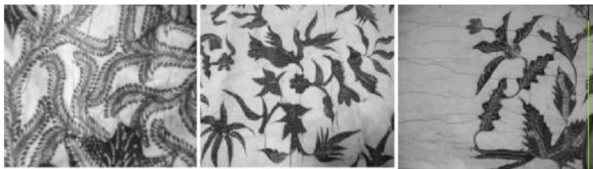
Foto 4. Batik sederhana hasil karya anak-anak

Motif khas dari batik Kotah ada beberapa, di antaranya motif rawan , seseq , kembang jeruk , sekar jagad , diris . Nama-nama motif batik tersebut juga diketahui atau dikenal oleh para pembatik, baik anak-anak maupun dewasa. Nama-nama motif dapat dikenal atau diketahui karena mereka terlibat langsung dalam membuat batik, sehingga secara tidak langsung mereka mendengar dan melihat nama-nama motif batik.