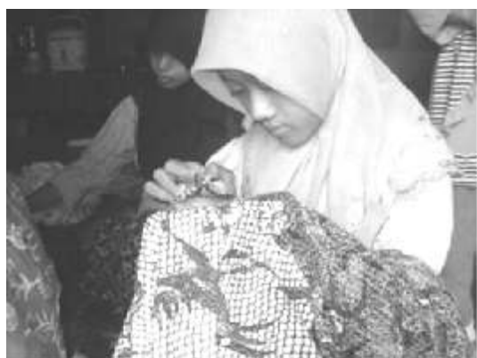
Foto 1. Seorang anak sedang membuat isen-isen .