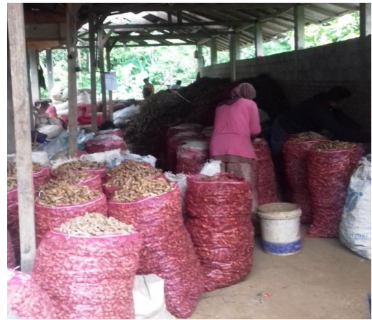
b. Proses sorting dan packing di UD Jahe Wangi