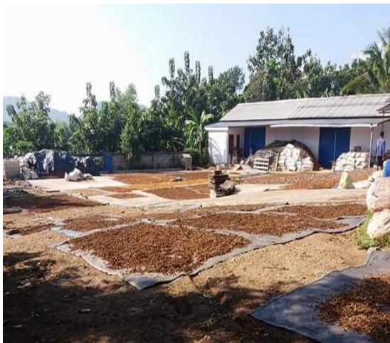
c. Tempat pengeringan di UD Tani Tlaten