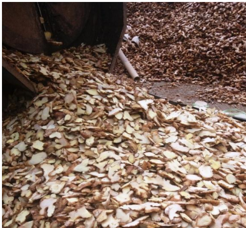
a. Perajangan jahe di UD Tani Tlaten

Secara umum, kondisi UD Jahe Wangi dan UD Tani Tlaten terlihat seperti berikut.