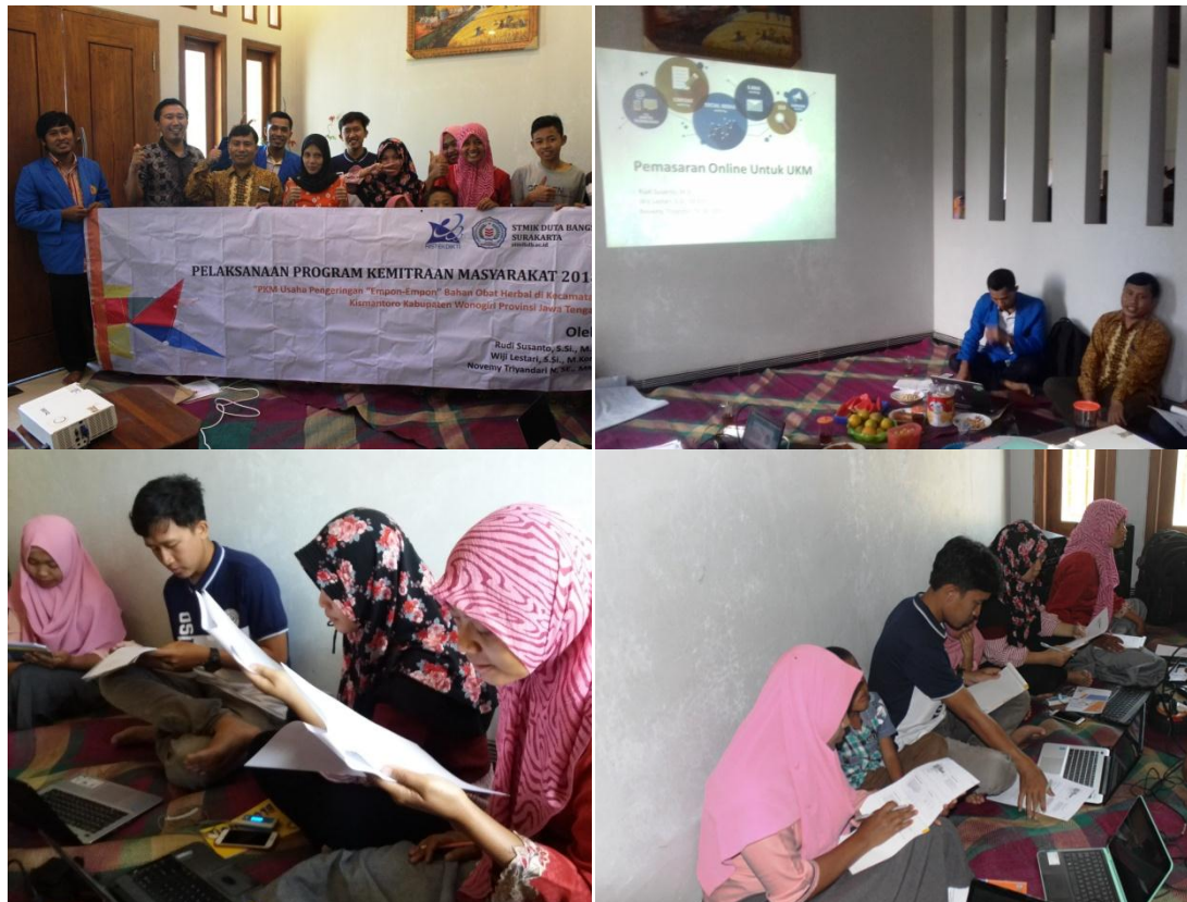
Gambar 3 Pelaksanaan Pelatihan

dengan materi pelatihan. Nilai rata-rata peserta setelah pelatihan adalah 91,67% menurut Tim PKM hasil tersebut mengindikasikan bahwa peserta memahami teori dan praktik terkait dengan materi pelatihan karena dalam pertanyaan terdapat praktik seperti “Bagaimana tahapan posting produk di suatu market place ?”