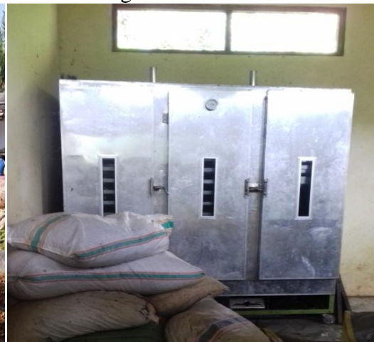
d. Oven pengering UD Jahe Wangi