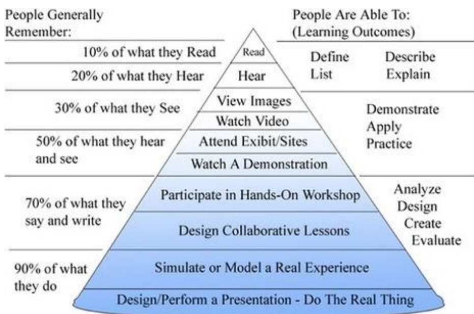
Dale's Cone of Experience

Persiapan lain adalah tim menyusun beberapa permainan atau game untuk di laksanakan pada saat kegiatan diantaranya adalah game cara berkenalan, game membagi kelompok. Mainan edukasi tersebut dipilih untuk mengasah kemampuan siswa yang disesuaikan dengan pengembangan nilai-nilai pendidikan karakter. Pemilihan mainan edukasi disesuaikan juga kontribusinya dalam memberikan pengalaman belajar. Dale's Cone of Experience menjadi tolok ukur dalam pemilihan mainan edukasi tersebut. Adapun Dale's Cone of Experience dapat di lihat dalam gambar 1.