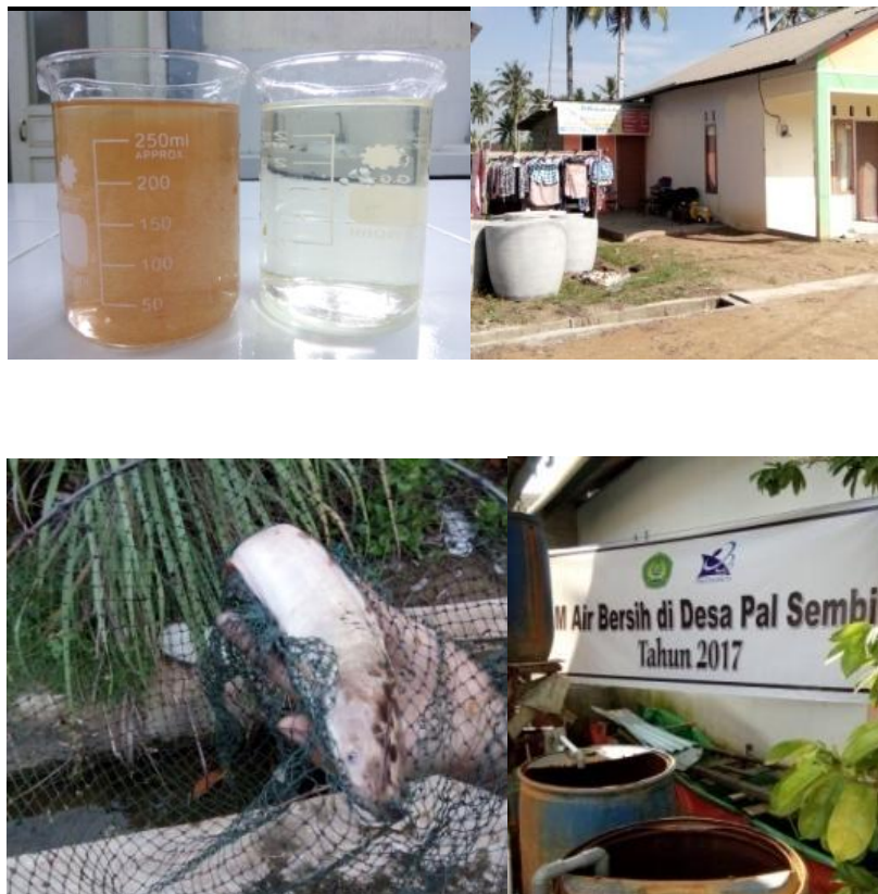
Gambar 2 Pelaksanaan IbM di Desa Pal Sembilan

termometer digital; 3) Bau dan rasa: status mutu air bisa diuji secara sederhana atau dapat dilakukan tes di laboratorium. Kadar bau dan kekeruhan diuji dengan mencampurkan air yang akan di ujidengan air bersih. Caranya campurkan segelas air baku yang akan diuji dengan air bersih, apabila keruh/bau hilang berarti kadar bau/keruhnya rendah, apabila masih tercium bau atau keruh, maka air tersebut sebaiknya tidak digunakan lagi.