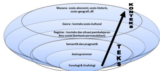
Gambar 2. Hubungan antara konteks keilmuan sosial, sistem kebahasaan, register, genre, dan wacana.

Konteks mempengaruhi berbagai aspek pada teks diataranya dalam genre, register, dan teks itu sendiri. Mengadaptasi penggambaran Motta-Roth (2010:322) mengenai hubungan konteks, tenre, register, dan teks, penulis menggambarkan bagaimana hubungan antara konteks keilmuan sosial, sistem kebahasaan, register, genre, dan wacana berhubungan sebagai berikut :