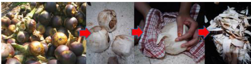
Gambar 3. Proses Pembersihan Kering

Langkah awal dalam proses pengolahan serat siwalan adalah adalah pembersihan serat yang bisa dilakukan dalam keadaan kering, atau basah. Proses pembersihan awal adalah pembersihan kering yaitu memisahkan kulit luar/cangkang dengan daging pada tempurung dan buah. Pemisahan menggunakan pisau dan diiris memanjang kebawah dan tidak memotong diameter buah. Hal tersebut untuk membatasi banyaknya serat buah siwalan yang pendek dan terpotong. Proses pembersihan kering menghasilkan daging/serat yang menempel pada tempurung.