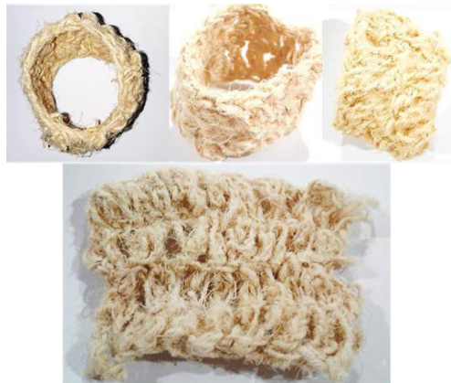
Gambar 7. Varian Studi Sederhana Rajut Yarn Serat Siwalan

Pada studi potensi kali ini, benang yang dihasilkan melalui penggintiran single yarn , yaitu penggintiran benang tunggal dari serat batok siwalan tanpa tambahan serat/benang bantu lainnya. Hal ini dilakukan untuk mengetahui karakter murni benang serat benang siwalan. Kondisi serat yang panjangnya tidak merata menghasilkan karakter fisik benang ekspresif atau tidak seimbang kadar kehalusannya dan terkesan “berbulu”. Benang serat batok siwalan cenderung berfungsi sebagai benang pakan. Karena tidak memerlukan proses kerja yang diharuskan stabil dalam menerima gesekan dan tarikan pada proses lanjutan dalam pembuatan lembaran menggunakan metode tenun. Sekaligus berfungsi sebagai elemen estetika permukaan. Serta benang serat batok siwalan dapat dijadikan bahan baku rajutan dengan karakter permukaan yang minim daya tarik mulurnya. Penyempurnaan yang akan menambah nilai estetika dan ekonomi produk adalah dengan pewarnaan dan kombinasi bahan lainnya.