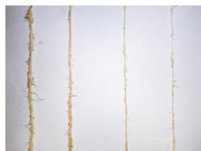
Gambar 6. Gambar Eksperimen Awal Varian Single Yarn Serat Siwalan