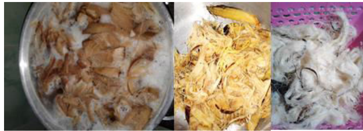
Gambar 4. Proses Pembersihan Basah

Proses pembersihan dilakukan untuk menghilangkan lemak, debu, dan kotoran sehingga mempermudah penyerapan zat warna. Zat kimia yang diperlukan diantaranya teepol . Teepol sebanyak \pm 20\text{ml}/500\text{gram serat}/3\text{L} dalam air mendidih selama 60 menit. Setelah itu dibilas 1 kali dalam air dingin dan siap proses selanjutnya. Proses degumming untuk menghilangkan zat lignin pada tumbuhan berselulosa. Serat akan terlihat lebih putih, dan pada tahap ini terjadi penghilangan secara kimia atau pigmen alami serat. Untuk menghilangkan zat lignin pada umumnya digunakan cairan \text{H}_2\text{O}_2 , Na silikat, dan teepol; masing-masing \pm 10\text{ml} , serta dididihkan selama 30-40 menit. Sementara proses penggelantangan/ bleaching dilakukan untuk menghasilkan serat yang lebih bersih dan putih, dengan menggunakan cairan pemutih dan menggunakan perendaman air dingin selama 30 menit, kemudian dibilas dan siap dikeringkan. Serat dikeringkan di ruangan terbuka dan dapat di bawah matahari langsung sampai kering tapi tidak sampai menggumpal keras.