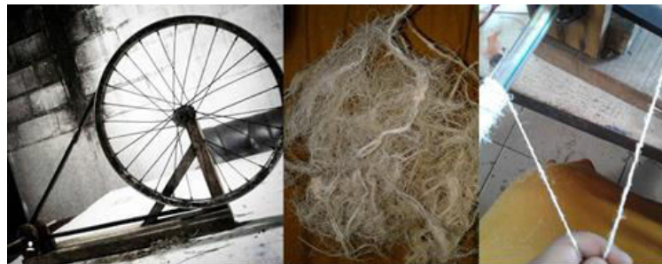
Gambar 5. Proses Pembersihan Basah

Penggintiran dilakukan setelah melalui proses pengeringan terlebih dahulu. Kemudian melalui proses pemisahan kering yang dapat dikerjakan secara manual untuk mencegah penggumpalan. Setelah serat menerima kerja pada tahapan diatas, serat siap memasuki tahap pemintalan menggunakan mesin/alat gintir sederhana.