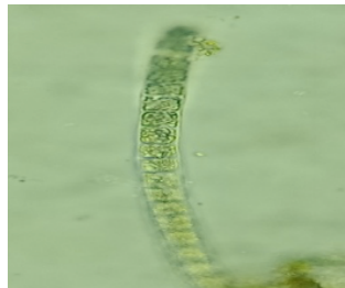
Gambar 2. Melosira sp (Perbesaran 40x10)

Hasil identifikasi Melosira sp dengan menggunakan buku identifikasi karangan Serediak & mailinh (2011), yaitu: 1b, 2a, 3a, 4a, 12a, 13a, yakni organisme mikroskopis, Sel dikelompokkan bersama untuk membentuk filament untai atau pita, kadang-kadang filamen dapat tumbuh dan terlihat secara massal, kloroplas memiliki warna saat segar mungkin rumput hijau, hijau pucat, emas coklat, hijau zaitun atau (jarang) kebiruan atau kemerahan, sel bergabung bersama untuk membentuk filamen terus menerus, dinding sel tanpa tanda jelas (Serediak dan Mailinh, 2011).