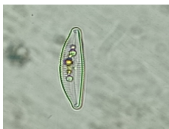
Gambar 3. Navicula sp (Perbesaran 40x10).

mailinh (2011), yaitu: 1b, 2b, 17a, 22a,23a, 24b, 25a yakni Organisme mikroskopis, Sel individu atau dalam kelompok yang mungkin teratur atau tidak teratur dalam bentuk tetapi tidak membentuk filamen, untai atau pita, Pigmen sel Lokal di kloroplas, sel disusun dalam koloni bentuk yang pasti, Sel koloni tanpa flagella, sel sebagian besar soliter, Kedua ujung mengecil dan membulat, pergerakan yang lambat (Serediak dan Mailinh, 2011).