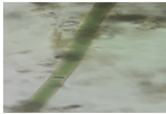
Gambar 1. Oscillatoria sp (Perbesaran 40x10)

banyak hijau zaitun, filamen atau trikoma tanpa percabangan, trikoma tidak membentuk spiral yang teratur, dapat bergerak, filamen dalam koloni dapat bergeser kedepan dan kebelakang.