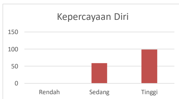
Grafik 2. Data Kepercayaan Diri

Berdasarkan grafik 1. Terlihat bahwa dari 158 peserta didik kelas VIII di SMPN 8 Yogyakarta di dapat sebanyak 100 peserta didik berada pada kategori tinggi, 58 peserta didik berada pada kategori sedang, dan tidak terdapat peserta didik yang berada pada kategori rendah. Hal tersebut juga terjadi dengan analisis kepercayaan diri. Sebagian besar sedangkan pada analisis data kepercayaan diri di dapat data 99 peserta didik berada pada kategori tinggi, 59 peserta didik berada pada kategori sedang, dan tidak terdapat peserta didik yang berada pada kategori rendah.