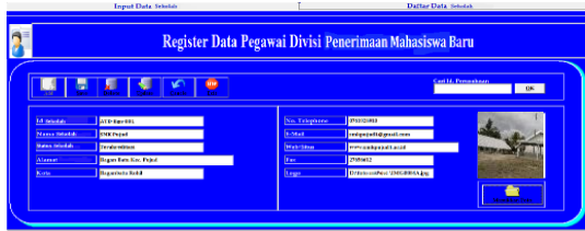
Gambar 8. Desain input Data Sekolah

Fungsi dari form entri data sekolah adalah untuk mengetahui data sekolah yang akan dikunjungi dan untuk mencari data sekolah yang sudah di visit oleh marketing.