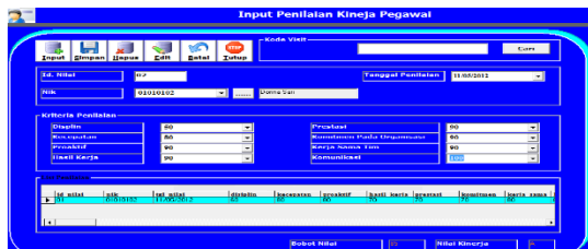
Gambar 9. Desain Penilaian Kinerja Pegawai

Form ini digunakan untuk input data penilaian terhadap pegawai marketing, dimana nantinya pimpinan bisa memonitoring kinerja dari setiap pegawai di divisi marketing.