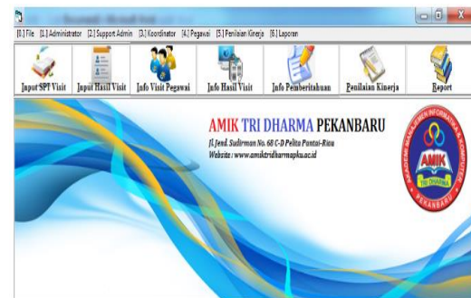
Gambar 6. Desain Menu Utama

Di dalam tampilan menu utama digambarkan pilihan pilihan apa saja yang dibutuhkan dalam sistem tersebut sesuai dengan hak akses yang diberikan.