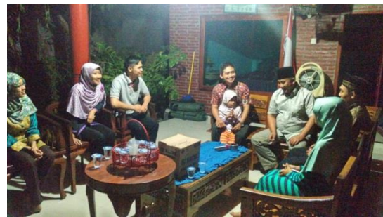
Gambar 1. Pelaksanaan Focus Group Discussion (FGD) internal (FGD Tahap 1) dengan melibatkan Kepala Desa dan Sekretaris Desa Paseban, Kecamatan Kencong, Kabupaten Jember (doc. Pribadi, 2017)