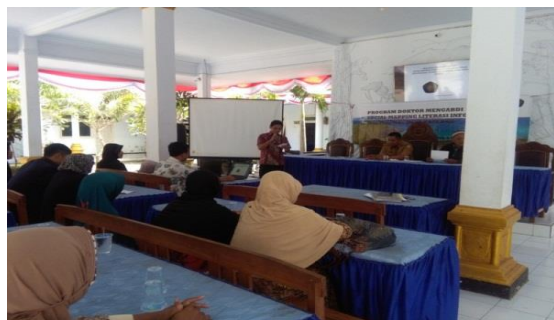
Gambar 2. Kegiatan: Pelaksanaan sosialisasi literasi informasi dan Focus Group Discussion (FGD) Terbuka (FGD Tahap 2) dengan melibatkan Perangkat Desa serta