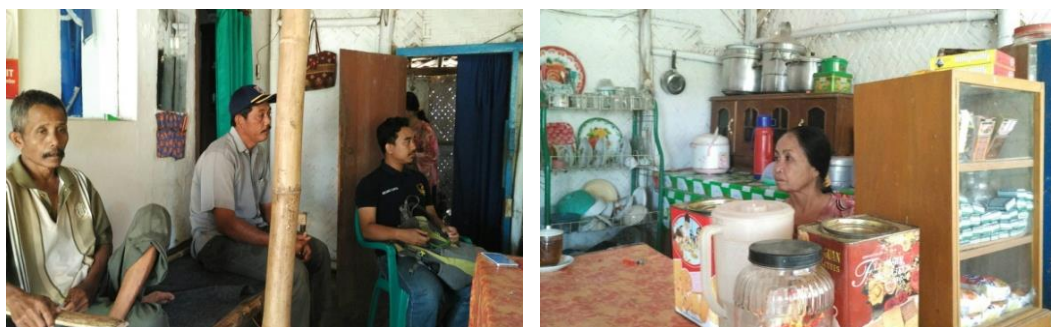
Gambar 4. Observasi dan wawancara langsung kepada masyarakat (langsung terjun oleh mahasiswa/enumerator) yang didampingi oleh petugas lapangan

Pedoman literasi informasi IFLA mencakup konsep literasi informasi dan standar kompetensi internasional yang dapat digunakan untuk mengetahui literasi informasi individu secara umum. Pedoman yang dibuat oleh IFLA dapat diadaptasi dan disesuaikan dengan kebutuhan lembaga yang bersangkutan. Proses analisis data yaitu: (1) working with data , (2) organizing it , (3) breaking it into manageable units , (4) synthesizing it , (5) searching for patterns , (6) discovering what is important and what is to be learned , dan (7) deciding what you will tell others .