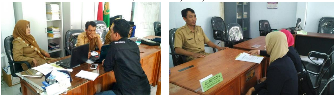
Gambar 3. Kegiatan: Pelaksanaan Focus Group Discussion (FGD) internal (FGD Tahap 3) dengan melibatkan Perangkat Desa Paseban, Kecamatan Kencong, Kabupaten Jember (doc. Pribadi, 2017)

perwakilan dari masyarakat Desa Paseban, Kecamatan Kencong, Kabupaten Jember (doc. Pribadi, 2017)