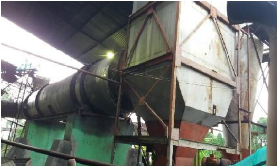
Gambar 3. Rotary Dryer

yang berfungsi untuk mengangkut ampas tebu ( bagasse ) yang dikeringkan pada silinder putar.