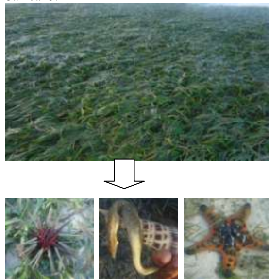
Gambar 3. Padang Lamun dan biota asosiasi di Gili Kere

Bila dibandingkan dengan lokasi yang lain Gili Kere memiliki karakteristik tersendiri diantaranya padang lamun yang cukup padat dengan persentaseutupan rata-rata 85%, kondisi padang lamun sangat baik dengan biota asosiasi cukup banyak (> 10 jenis), substrat dasar pasir putih dengan kejernihan air rata-rata 90% serta kedalaman lamun yang dijumpai pada kisaran 0,5 sampai 1 meter. Gambaran kondisi padang lamun di Gili Kere dan contoh biota asosiasinya dapat dilihat pada Gambar 3.