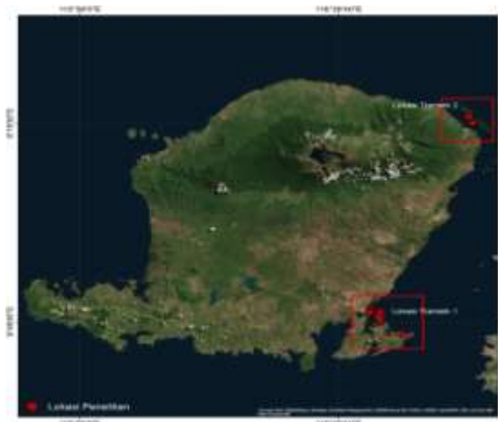
Gambar 1. Sebaran Lamun Lombok Timur

Berdasarkan hasil observasi diperoleh 8 titik lokasi ditemukan padang lamun yaitu pada transek 1 terdiri dari beberapa sub transek yaitu pantai yang ada di Lombok Selatan diantaranya Pantai Poton Bakau, Gili Kere, Gili Bembek, Gili Sunut, Pantai Pink (Pantai Tangsi) dan Te Elong-elong, sedangkan pada transek 2 lokasinya berada di Gili Sulat dan Gili Lawang. Kondisi padang lamun di tiap lokasi cukup bagus dengan sebaran paling luas yaitu di Gili Kere dan Pantai Poton Bakau serta yang paling sedikit yaitu di Pantai Te Elong-Elong. Berikut adalah peta sebaran padang lamun di Kabupaten Lombok Timur :