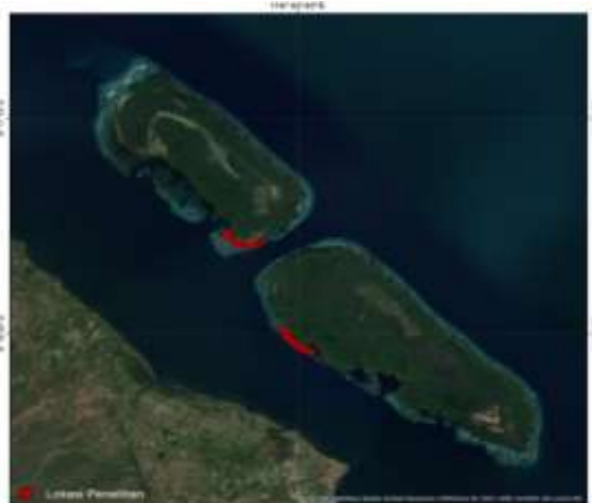
Gambar 3. Transek 2 (Sebaran lamun Gili Sulat dan Gili Lawang)