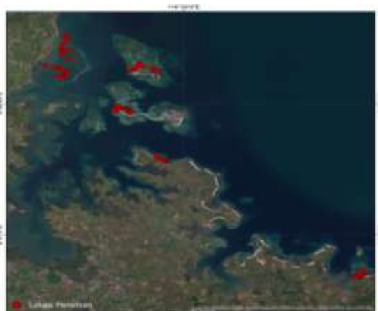
Gambar 2. Transek 1 (sebaran lamun lombok selatan)