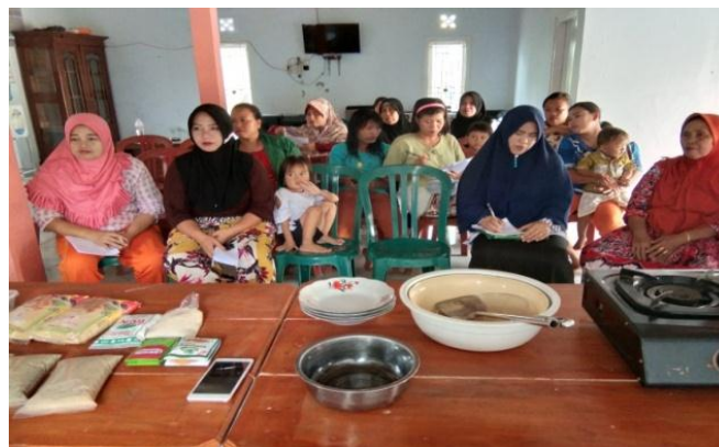
Gambar 3. Sosialisasi Pembuatan Produk

Ikan yang digunakan yaitu jenis ikan tenggiri. Ikan tenggiri digunakan dalam bahan baku ini dikarenakan ikan tenggiri merupakan ikan terbanyak dari hasil panen masyarakat pekon Way Nipah. Selain itu ikan tenggiri memiliki jaringan kualitas daging yang baik (banyak mengandung aktin dan miosin) sehingga diharapkan dapat membentuk emulsin yang baik. Ikan tenggiri ( Scomberomorus commersoni ) merupakan komoditi sumberdaya ikan pelagis yang mempunyai arti ekonomis cukup tinggi dan digunakan sebagai komoditi ekspor maupun untuk pemenuhan kebutuhan dalam negeri. Ikan tenggiri mengandung kurang lebih 18% - 22% protein, 0,2% - 5% lemak, karbohidrat kurang dari 5%, air 60% - 80% (Sudarias, 2012).