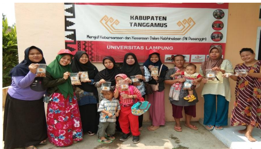
Gambar 8. Foto Bersama Ibu PKK dan KKN