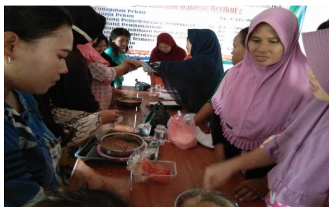
Gambar 4. Praktek Pembuatan Produk

Ikan tenggiri (Gambar 5) memiliki zat-zat yang berguna bagi tubuh. Kandungan gizi untuk ikan tenggiri juga tinggi, sehingga nugget yang dihasilkan pun menghasilkan kandungan yang memiliki protein yang tinggi. Kandungan gizi yang terdapat dalam ikan tenggiri dapat dilihat pada Tabel 2.