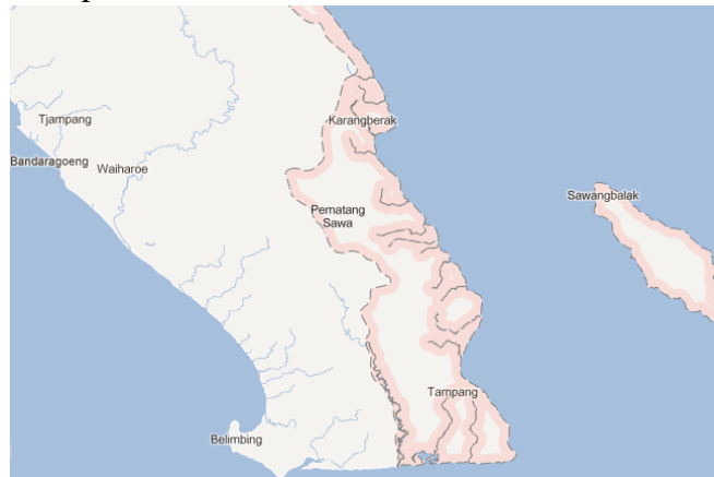
Gambar 2. Peta Pekon Way Nipah

Pekon Way Nipah merupakan pekon yang terletak di kecamatan Pematang Sawa. Pekon Way Nipah dapat dilihat pada Gambar 2.