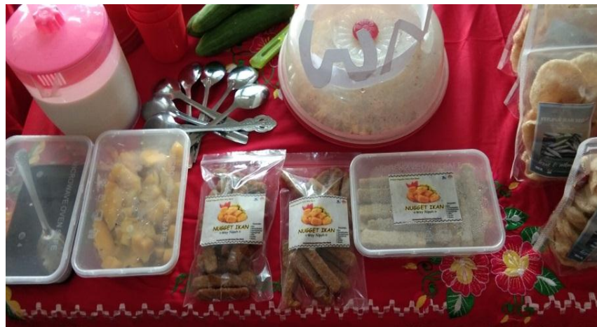
Gambar 7. Pameran Produk Pekon Way Nipah

Olahan produk nugget ikan telah disetujui oleh kepala pekon untuk menjadi produk unggulan pekon dan akan dimasukkan dalam anggaran desa sebagai kegiatan PKK pada tahun berikutnya. Kegiatan pemberdayaan masyarakat harus mampu mengembangkan teknik-teknik pendidikan tertentu yang imajinatif untuk menggugah kesadaran masyarakat. Menurut Silkhondze (1999) orientasi pemberdayaan masyarakat haruslah membantu masyarakat agar mampu mengembangkan diri atas dasar inovasi-inovasi yang ada, ditetapkan secara partisipatoris, yang pendekatan metodenya berorientasi pada kebutuhan masyarakat dan hal-hal yang bersifat praktis.