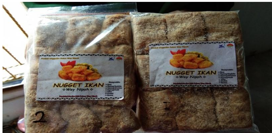
Gambar 6. Produk Nugget Pekon Way Nipah

Hasil yang telah dicapai dalam pelatihan ini berupa produk nugget pekon Way Nipah dengan packaging bentuk plastik yang telah ditempel oleh sticker yang telah di design oleh peserta KKN Kebangsaan pekon Way Nipah, terlihat pada Gambar 6.