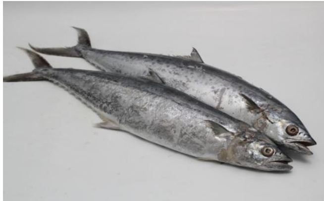
Gambar 5. Ikan Tenggiri