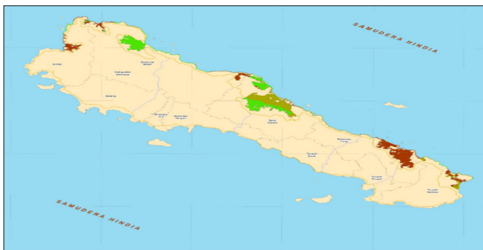
Gambar 3. Potensi Pengembangan Budidaya Lobster di Kabupaten Simeulue (2015)

Lobster yang merupakan komoditas prospektif, yang menopang perekonomian Simeulue dapat dikembangkan melalui inovasi budidaya yang tepat dengan pengendalian penangkapan di lautan. Implementasi Kepmen KP No. 1 Tahun 2015 di Simeulue sangat sulit dilakukan karena tenaga pengawas untuk memantau peraturan tersebut sangat terbatas. Pemantauan hanya dilakukan oleh dua petugas UPT Karantina Kelautan dan Perikanan saat pengiriman Lobster ke luar Simeulue oleh Pedagang Besar (antar pulau). Pada Tahun 2006 Pemda Kabupaten Simeulue telah mengeluarkan Peraturan Bupati No. 523.1/104/SK/Tahun 2006 tentang Penetapan Kawasan Konservasi Laut Daerah, salah satu