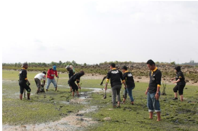
Figure 5. Foto Kegiatan Penanaman Mangrove