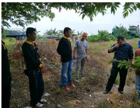
Figure 1. Foto kegiatan Survey lokasi penanaman mangrove

cara yang utama untuk mengumpulkan data primer bila data sekunder dianggap belum cukup lengkap untuk menjawab sesuatu pertanyaan. Pada tahapan ini tim melakukan survey ke Kelurahan Tanjung Sengkuang RT 05 RW 01. Dimana kegiatan survey ini adalah kegiatan awal yang kami lakukan guna untuk memperoleh data dan informasi faktual dari masyarakat Kelurahan Tanjung Sengkuang. Dalam kegiatan ini kami melihat lokasi pantai dan kerusakan-kerusakan yang dibuat nelayan, dan limbah industri, dan sekaligus menentukan titik lokasi penanaman mangrove. Dari hasil kegiatan survey ini tim membuat rencana dan agenda untuk menyusun program selanjutnya.