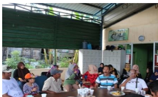
Figure 2. Foto Penyuluhan Penanaman mangrove

Penyuluhan , pada tahapan ini tim mengumpulkan masyarakat untuk menyamakan visi dan misi kegiatan ini terlebih dahulu, kemudian tim mengundang pemateri dari dinas lingkungan hidup kota Batam untuk memberikan penjelasan tentang manfaat dari ekosistem mangrove untuk kehidupan masyarakat.