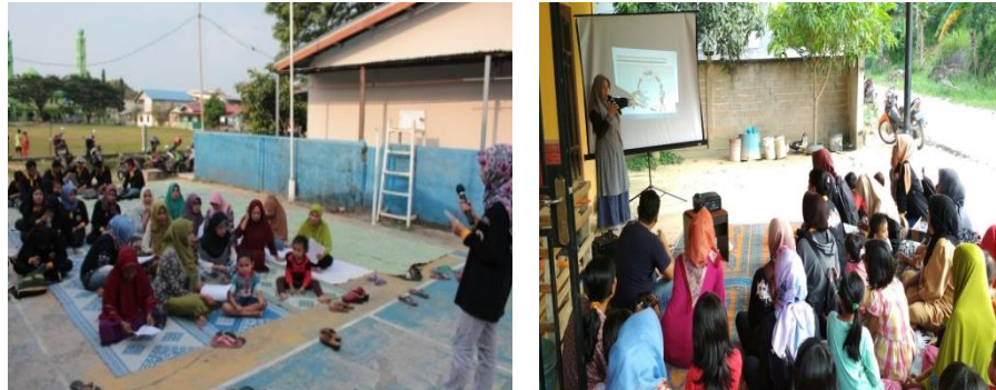
Figure 3. Foto Ceramah dan persentasi penanaman mangrove

Tanjung Sengkuang dan Ibu-ibu PKK RT 05 RW 01.