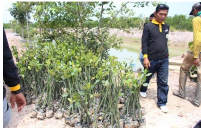
Figure 4. Foto Persiapan Bibit Mangrove

Persiapan , dalam kegiatan ini tim dan beberapa orang mahasiswa mempersiapkan dan mimilah bibit mangrove yang sudah bisa ditanam di Rumah Bakau Indonesia (RBI). Bibit mangrove yang sudah bisa ditanam biasanya ketika sudah berumur 6 bulan dan telah memiliki 4 buah daun.