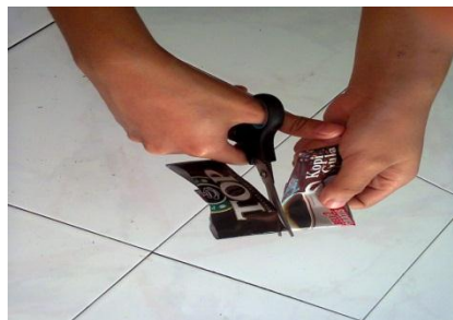
Gambar 1 Proses menggunting bungkus kopi