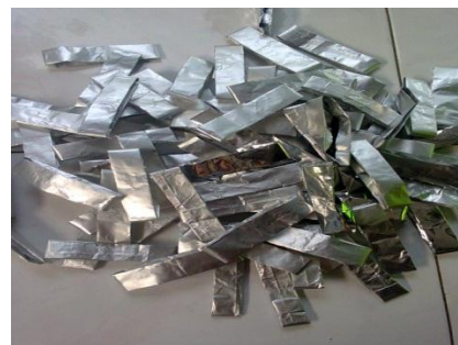
Gambar 2 Lipatan Bungkus Kopi