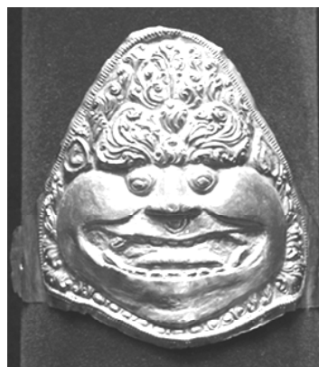
Gambar 2. Perhiasan gelang lengan (kelat bahu) bermotif kala yang memiliki rahang bawah, koleksi Museum Nasional Jakarta.

Motif kala dan makara yang umumnya diterapkan di candi Jawa pada masa klasik awal, dalam perkembangannya pada masa klasik akhir motif tersebut sering diterapkan pada perhiasan pribadi, misalnya sebagai hiasan untuk perhiasan gelang, dan perhiasan telinga (John N Miksic, 1990: 112).