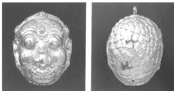
Gambar 1. Perhiasan emas bermotif kepala raksasa ( kala ) tanpa rahang bawah. Perhiasan dari sisi depan (kiri) dan belakang (kanan).

Motif kala dan makara yang umumnya diterapkan di candi Jawa pada masa klasik awal, dalam perkembangannya pada masa klasik akhir motif tersebut sering diterapkan pada perhiasan pribadi, misalnya sebagai hiasan untuk perhiasan gelang, dan perhiasan telinga (John N Miksic, 1990: 112).