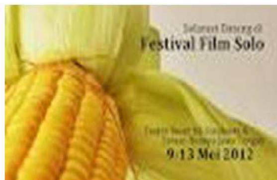
Gambar 3. Poster Festival Film Indonesia (FFI) Festival Film Solo (FFS)