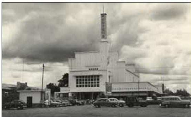
Gambar 1. Bioskop pertama di Indonesia