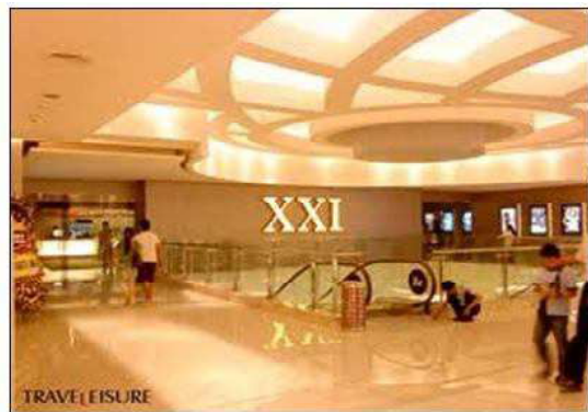
Gambar 2. Bioskop saat ini di Indonesia