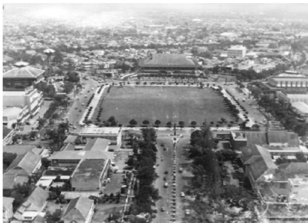
Gambar 5. Kawasan Simpang Lima era 1970-an

Pada perkembangannya, bagi masyarakat yang pernah tinggal di Pleburan masa lalu yang merupakan rumah dinas para pejabat muncul sebuah nostalgia dan romantika akan daerah tersebut, terutama dengan jalan-jalannya, merasa memiliki dan mencintai.