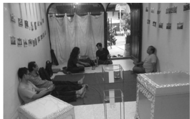
Gambar 1. Suasana Diskusi dengan Responden atau Partisipan Diskusi

Pameran foto dan pemutaran video yang disajikan kepada peserta diskusi berupaya membangun kembali rekam jejak visualitas para partisipan diskusi. Menariknya, dari sajian foto-foto kawasan Simpang Lima yang beragam dan pemutaran video, respon peserta diskusi mempunyai keragaman yang disusun atas dasar visualitas partisipan, praktik keseharian yang menjadi bahan perbincangan atas dasar reaksi dan respon terhadap foto dan video yang mereka saksikan. Pada proses dialogis ini antara partisipan, peneliti dan objek kajian merupakan satu mata rantai awal penelitian yang menjadi karakter dalam pembahasan persoalan/permasalahan mengenai eksperimentasi penciptaan city branding Kota Semarang melalui FGD .