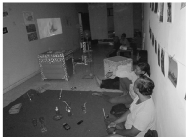
Gambar 6. Menonton Video Penggambaran Organologi Rebab