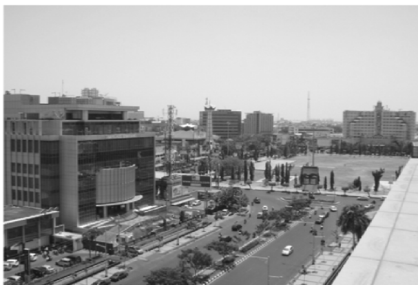
Gambar 2. Kawasan Simpang Lima

Pembacaan awal dalam kelompok diskusi mengenai keberadaan kawasan Simpang Lima pada kondisi saat ini melalui medium foto memberi stimulan kepada responden untuk bercerita mengenai kawasan tersebut sekaligus prolog. Dengan penyajian alur diskusi yang terbagi menjadi segementasi sederhana berupa ; (a) melihat foto kawasan Simpang Lima Semarang masa kini, (b) melihat foto kawasan Simpang Lima Semarang masa lalu, (c) melihat tayangan video mengenai organologi rebab, dan (d) melihat perbandingan kawasan Simpang Lima Semarang dengan peta dan organologi rebab, maka diharapkan diskusi kelompok ini berjalan secara komprehensif. Hasil temuan-temuan yang terjadi dalam diskusi dapat dipaparkan menjadi penjelasan yang sederhana dengan orientasi kepada penggalian informasi tahap awal mengenai kawasan Simpang Lima dilihat dari cara pandang responden atau partisipan.