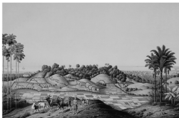
Gambar 3. Litograf karya Junghun yang memperlihatkan panorama kota Semarang (termasuk simpanglima) dari perbukitan

Melihat kawasan Simpang Lima Semarang pada masa lalu merupakan materi diskusi selanjutnya. Responden atau partisipan diskusi diperlihatkan foto-foto dan litograf kawasan Simpang Lima Semarang pada era 1920-an hingga 1990-an. Hal ini bertujuan melihat pembacaan responden pada sisi nostalgia yang dibangun oleh memori-memori pengalaman dan pengetahuan mereka terhadap kawasan Simpang Lima pada masa lalu. Tujuan dari diskusi ini adalah memberi penguatan akan keberadaan Kota Semarang pada masa lalu dengan melihat potensi sejarah dan karakter kota yang dibentuk pada era kolonial dan era kemerdekaan saat itu.