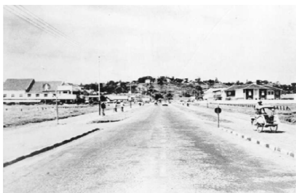
Gambar 4. Kawasan Simpang Lima era 1950-1960an