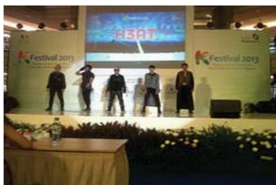
Gambar 2 Penampilan Salah Satu Kelompok Peserta Lomba K-pop Dance (sumber: Dokumen Dinny Devi Triana, 2013)

Menurut Hawkins, secara konseptual tari adalah ekspresi perasaan manusia yang diubah oleh imajinasi dan diberi bentuk oleh media gerak sehingga menjadi bentuk gerak yang simbolis sebagai ungkapan si penciptanya (Hawkins, 1990: 2). Dengan demikian tari merupakan bentuk pernyataan imajinasi yang dituangkan melalui lambang gerak, yang memiliki ruang, waktu, dan tenaga. Pernyataan lambang atau simbol dari imajinasi dan kehendak dalam bentuk gerak tari telah mengalami distorsi atau stilasi dengan mempertimbangkan pada keindahan dan pesan yang disampaikan. Pada akibatnya, gerak mempunyai makna yang memberikan penjelasan maksud dan muatan tari.