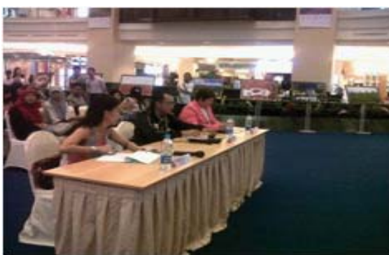
Gambar 1 Juri Lomba K-pop Dance yang diselenggarakan di Jakarta (sumber: Dokumen Dinny Devi Triana, 2013)

Penelitian ini menggunakan metode penelitian mix method yaitu menggabungkan metode penelitian kualitatif untuk mendapatkan instrumen yang baik dari sisi konten atau materi melalui Fokus Group Discussion , sedangkan metode kuantitatif dilakukan melalui metode survai, dengan dua tahap kalibrasi untuk memperoleh instrumen yang valid dan reliabel. Kalibrasi instrumen yang dilakukan berulang-ulang di masing-masing tempat penelitian. Di harapkan model penilaian kinestetik dalam menilai penampilan tari ini dapat digunakan oleh juri atau penilai.