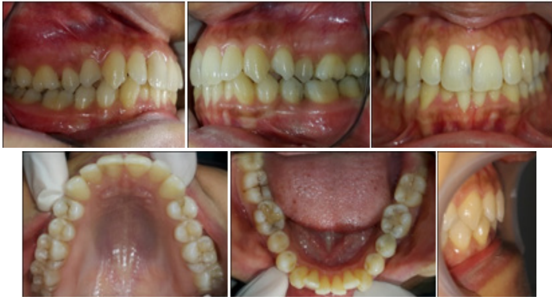
Gambar 2. Foto intra oral pasien sebelum perawatan