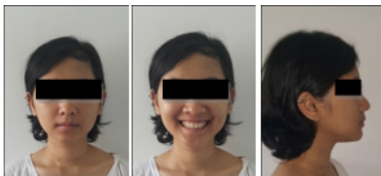
Gambar 1. Foto profil pasien sebelum perawatan

Riwayat kesehatan umum pasien baik dengan tinggi badan 153 cm dan berat badan 44 kg. Pemeriksaan ekstra oral memperlihatkan tipe wajah normal, simetris dengan profil muka