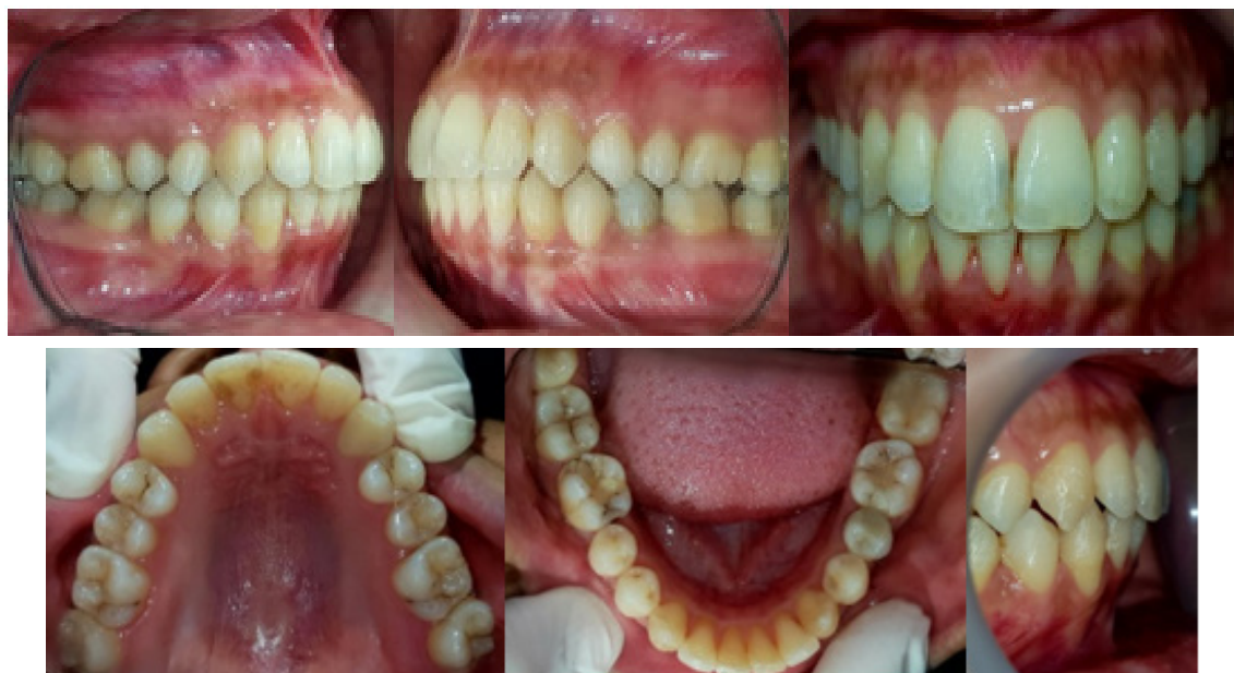
Gambar 4. Foto intra oral pasien sesudah perawatan