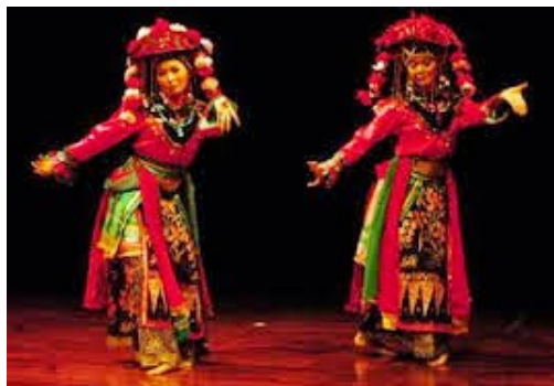
Gambar 3. Penari Cokkek

Tari Cokkek yang disaksikan pada resepsi perkawinan adat Betawi menggunakan pakaian yang berasal dari Tiongkok