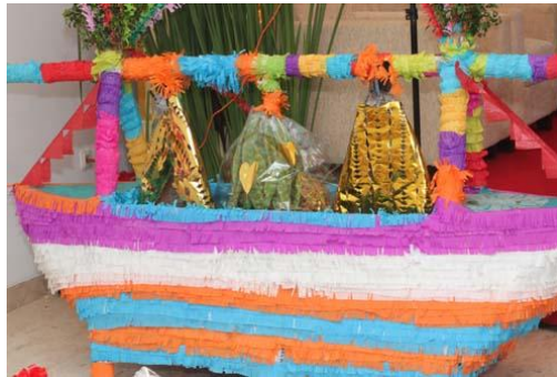
Gambar 2. Jung Betawi

Jung adalah miniatur perahu Tiongkok yang juga sebagai seserahan seperti Sie. Jung memiliki makna sebagai lambang kesiapan pasangan pengantin mengarungi gelombang laut kehidupan dengan asam manis pahit getir dan harus tetap kuat dalam menghadapinya