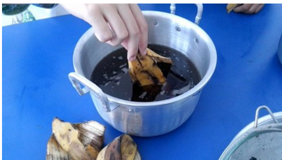
Gambar 4. Penjernihan Minyak Jelantah Dengan Kulit Pisang

Proses penjernihan minyak menghasilkan minyak dengan karakteristik tidak berbau dan warna lebih jernih jika dibandingkan dengan semula. Bau menyengat yang berasal dari minyak jelantah sudah hilang. Dengan perendaman arang yang lebih lama akan menghasilkan warna yang lebih jernih.