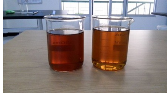
Gambar 5. Hasil Penjernihan Minyak

Proses penjernihan minyak menghasilkan minyak dengan karakteristik tidak berbau dan warna lebih jernih jika dibandingkan dengan semula. Bau menyengat yang berasal dari minyak jelantah sudah hilang. Dengan perendaman arang yang lebih lama akan menghasilkan warna yang lebih jernih.