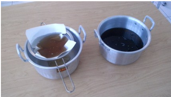
Gambar 3. Penjernihan Minyak Jelantah Dengan Arang

Secara umum adsorpsi adalah proses pemisahan komponen tertentu dari suatu larutan ke permukaan zat padat yang menyerap (adsorben) dalam hal ini adalah arang dan kulit pisang. Pemisahan terjadi karena perbedaan bobot molekul atau porositas, menyebabkan sebagian molekul terikat lebih kuat ke permukaan molekul lainnya (Yustinah, 2011). Dengan demikian, permukaan arang bersifat non polar. Selain komposisi dan polaritas, struktur pori juga merupakan faktor yang penting berhubungan dengan luas permukaan, semakin kecil pori-pori arang mengakibatkan luas permukaan semakin besar, dengan demikian kecepatan adsorpsi bertambah. Oleh karena itu, arang dipecah terlebih dahulu sebelum digunakan sebagai adsorben.