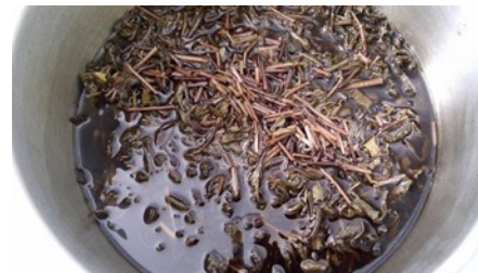
Gambar 1. Proses Maserasi Daun Teh Hijau

Dari hasil maserasi 151 gram daun teh hijau dengan menggunakan alkohol 70% diperoleh ekstrak kental sebanyak 27 ml dengan karakteristik warna coklat muda pekat, bau harum khas teh, dan rasa pahit.