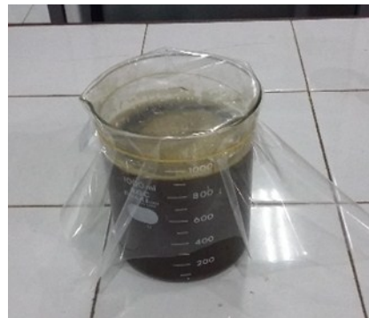
Gambar 2. Ekstrak Kental Daun Teh Hijau