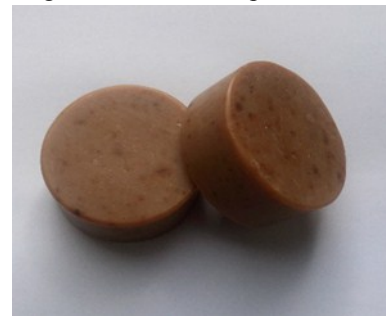
Gambar 6. Sabun Minyak Jelantah Ekstrak Daun Teh

Dari hasil reaksi penyabunan diperoleh sabun berwarna krem kecokelatan dan bau green tea . Warna cokelat ini bisa diatasi dengan melakukan remaserasi atau maserasi ulang terhadap ekstrak yang sudah diperoleh. Namun hal ini memerlukan waktu yang lama dan jumlah pelarut (alkohol) yang banyak. Warna sabun yang kurang menarik dapat diatasi dengan menambahkan pewarna makanan.