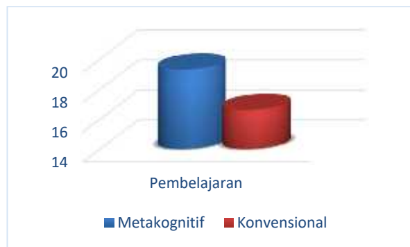
Gambar 1. Rerata Marginal Komparasi Ganda Antar Baris

Dari hasil analisis data dengan melihat rerata marginalnya (rerata meta-kognitif = 19,29) lebih besar dari pada (rerata konvensional = 16,61) ( Main effect ) pada Gambar 1 dapat disimpulkan bahwa mahasiswa yang diberikan dengan pembelajaran metakognitif mempunyai kemampuan pemecahan masalah yang lebih baik dari pada mahasiswa yang diberikan dengan pembelajaran konvensional.