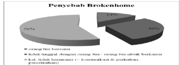
Grafik 4. Perilaku Siswa Broken home