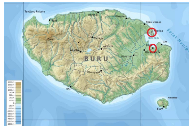
Peta 1. Judul peta