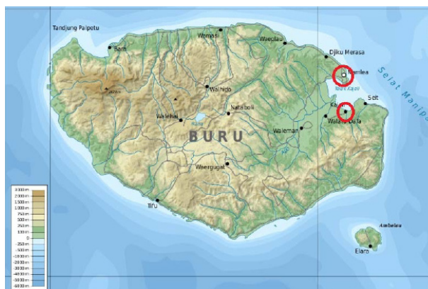
Peta 1. Judul peta (Sumber: .....)