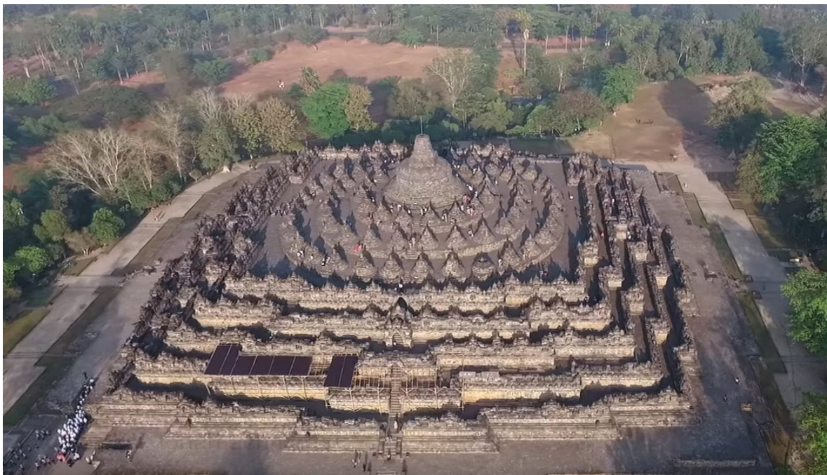
Foto 1. Candi Borobudur

Untuk menuju tiap tingkat terdapat tangga pada tiap sisi bangunan. Tangga utama terletak pada sisi timur, tempat relief cerita dimulai. Bangunan Candi Borobudur dilengkapi pula dengan saluran-saluran air yang terdapat pada tiap sudut dan tingkat. Ujung pancuran air berupa makara yang dibentuk dan diukir sangat indah. Relief yang dipahatkan ada yang merupakan