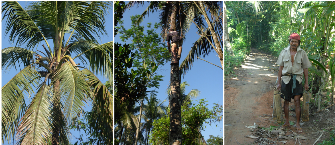
Foto 4. Pohon aren atau enau yang sedang disadap (kiri), diambil sadapannya (tengah), dan aren yang disadap dibawa oleh penyadapnya (kanan)

jātirasa, kiñca, madya, māsawa/māstawa, miñu, sajēṅ, siddhu/sindhu, surā, tampo, twak/tok, dan waragaṅ (Nastiti 1989, 86). Beberapa jenis minuman keras itu masih dikenal sampai sekarang, seperti arak, tuak, dan brēm. Satu-satunya naskah yang menyebutkan buḍur sebangsa pohon aren didapatkan dari “Kakawin Kāṇḍawawanadahana” (Terbakarnya Hutan Kāṇḍawa), naskah yang sampai saat ini belum diterjemahkan dari Cod Kirtya No. 709. Dalam teks disebutkan: 247. gumaway kuwwa-kuwwana ..... hinatēpan tēkap rwan iṅ buḍur (membuat perumahan sementara ..... dengan atap dari daun buḍur ) (Zoetmulder 2004).