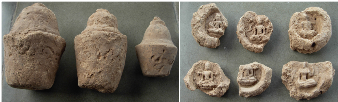
Foto 3. Stūpika dan Votive Tablet yang ditemukan di Candi Borobudur

tersebut, dapat diduga bahwa areal yang digali berupa pemukiman. Selain ekskavasi, indikasi adanya pemukiman di sekitar Candi Borobudur tersingkap oleh bulldoser yang digunakan dalam pemugaran Candi Borobudur antara tahun 1971-1974. Temuannya, selain ribuan pecahan gerabah, pecahan keramik, stūpika, berupa struktur bangunan bata, balok-balok batu yang telah dibentuk, juga sejumlah susunan batu kali, fragmen arang, gigi, dan tulang binatang (Mundardjito 2014).