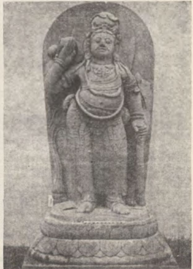
Arca Hayagriwa dari Candi Jago

b. Pada lajur undak-undak itu sendiri terlukis relief-relief yang menggambarkan ceritera Parthayajnya, yang mengambil lahannya dari Mahabharata. Ceritera itu mulai pada sudut baratdaya dengan permainan judi antara Pandawa dan Kaurawa. Karena permainan yang curang dari para Kaurawa maka Yudistira kehilangan semua harta miliknya dan kerajaannya, dan Draupadi pun (istri kelima orang saudara) termasuk kehilangan itu. Oleh pihak lawan ia dihina dengan sangat, kainnya direnggutkan hingga lepas, rambutnya diragut hingga terurai. Maka bersumpahlah ia tidak akan merasa terbalas sebelum ia mencuci rambutnya dengan darah Duryodhana. Setelah kejadian yang menghina itu, maka dimufakati bahwa para Pandawa dibuang selama 15 tahun. Bersama-sama dengan ibu dan istri mereka masuk ke dalam hutan. Atas nasehat sahabat mereka, Widura, Arjuna memisahkan diri dari keluarganya untuk bertapa di Gunung Indrakila, supaya mendapat senjata-senjata sakti untuk memerangi para Kaurawa kelak. Dalam perjalanan ke Gunung Indrakila ia mengalami berbagai