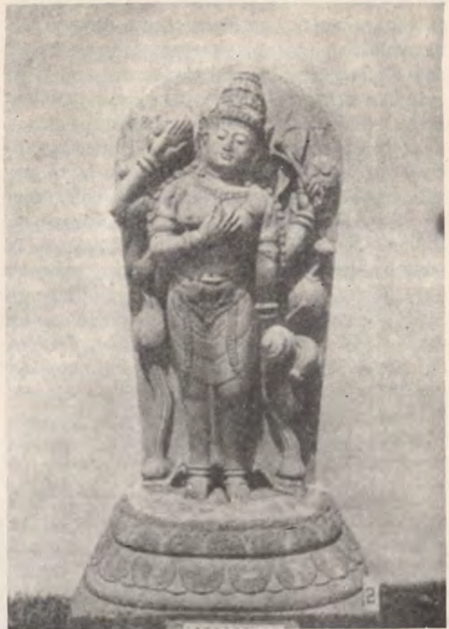
Arca Bhirkuti dan Candi Jago

Dari candi itu sendiri tidak banyak yang tinggal, hanya kakinya, kambi pintu, dan sebagian kecil dari tubuhnya. Pada tubuh candi itu dahulu terdapat relung-relung pada ketiga dinding luar dan di kanan kiri pintu masuk. Bilik candi dapat ditutup dengan sebuah pintu, sebagaimana ternyata dari lubang-lubang di samping jenjang-jenang pintu. Di dalam lantai bilik candi sekarang terdapat lubang gangsiran yang besar dan dalam; tetapi perigi tidak terdapat di dalamnya, karena itu tidak ditemukan juga sebuah peripih. Hal itu agak mengherankan, karena di dalam kesusasteraan kuno Candi Jago disebutkan di antara candi-