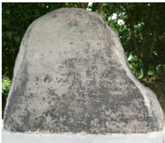
Foto 1. Prasasti Palas Pasemah.

Objek yang terdapat pada lahan taman purbakala adalah prasasti. Prasasti berada pada bangunan tanpa dinding yang terletak di bagian selatan lahan. Prasasti ini dahulu berada di aliran sungai. Bahan prasasti berupa batuan andesit. Bagian yang tampak sekarang berukuran tinggi 59 cm, lebar 76 cm. Bagian atas tebalnya 9 cm, sedangkan bagian bawah 30 cm. Sebelum disemen tinggi prasasti adalah 65 cm (Utomo, 2007: 10).