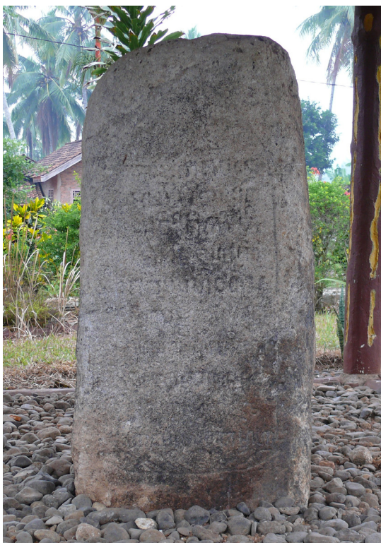
Foto 4. Prasasti Batu Bedil (Dok. Balai Arkeologi Bandung, 2009).

batu yang menghadap ke utara. Prasasti terdiri atas 10 baris dengan tinggi huruf sekitar 5 cm. Tulisan tersebut berada dalam satu bingkai. Pada bagian bawah bingkai terdapat goresan membentuk padma atau bunga teratai. Kondisi huruf sudah aus sehingga banyak huruf yang sudah tidak terbaca lagi.