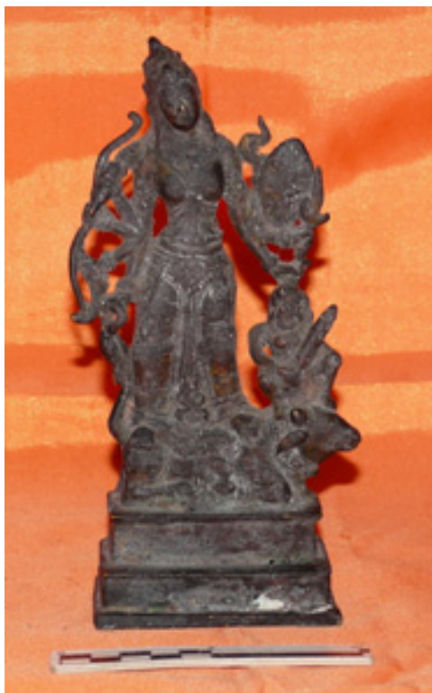
Foto 6. Durgamahisasuramrdini.