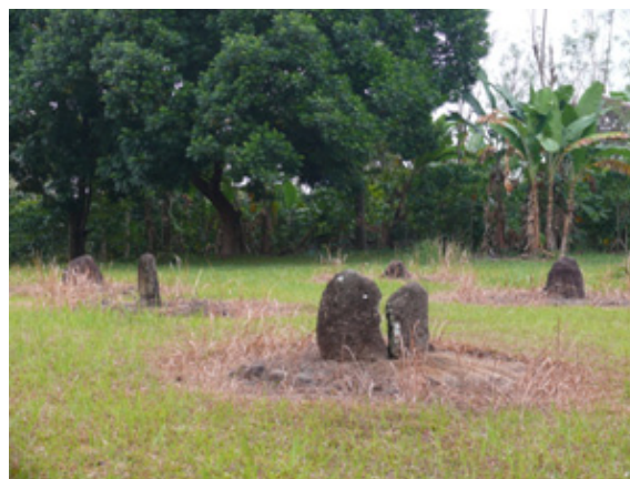
Foto 3. Tinggalan megalitik di Situs Batu Bedil.

Situs Batu Bedil secara administratif berada di Desa Gunung Meraksa, Kecamatan Pulau Pangung, Kabupaten Tanggamus. Secara geografis lokasi ini berada di wilayah hulu Way Sekampung. Bentang alam daerah berupa pedataran bergelombang. Secara umum ketinggian berkisar antara 300 – 400 m dpl. Pemanfaatan lahan selain untuk pemukiman juga digunakan untuk lahan perkebunan, ladang, dan sawah. Sungai yang mengalir di daerah ini antara lain adalah Way Ulok Ngaherong beserta anak-anak sungainya dan Way Ilahan. Aliran Way Ulok Ngaherong dengan anak-anak sungainya bersatu dengan Way Ilahan. Sistem