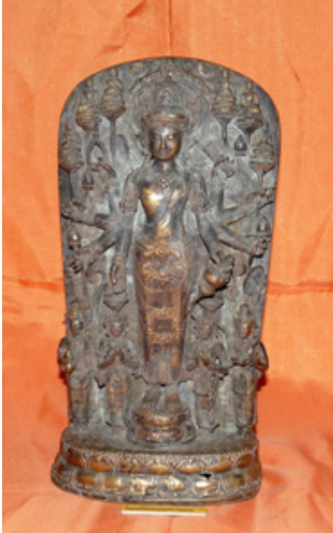
Foto 8. Dhyani Bodhisatwa Avalokiteśvara.

kanan paling bawah terbuka. Tangan kiri paling atas menggenggam gulungan kertas, tangan kiri kedua dari atas memegang tangkai padma yang pada kelopakannya terdapat arca Buddha dengan kedua telapak bertemu di depan dada, tangan kiri ketiga dari atas memegang kuncup bunga, dan tangan kiri paling bawah membawa kendi.