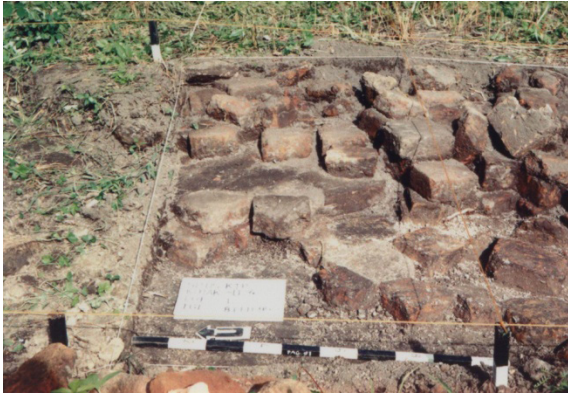
Foto 9. Runtuhan struktur bata di situs Ketapang.

yang dibentuk seperti bata. Bata utuh yang ditemukan berukuran 40 x 18 x 8 cm.