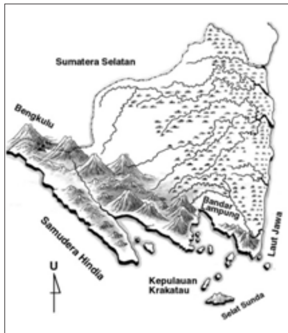
Gambar 1. Relief Lampung.