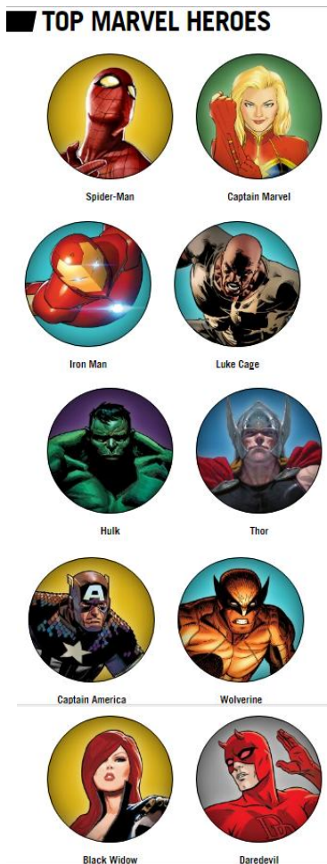
Gambar 7 Top Marvel Heroes

Dari data tersebut keempat karakter yang dipilih sebagai lisensi produk masuk ke dalam karakter terfavorit menurut marvel.com .