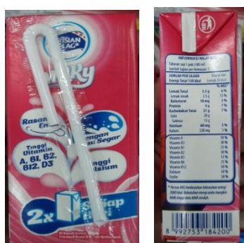
Gambar 1 informasi kemasan

Dari informasi yang ditampilkan pada kemasan minuman tersebut didapat kesimpulan bahwa manfaat yang dapat diperoleh konsumen disaat mengkonsumsi susu tersebut adalah mampu memproduksi energi yang lebih, menambah kekuatan dari tubuh, memiliki kekebalan tubuh yang lebih baik. Dengan informasi tersebut target pasar yang membeli produk sudah dapat memperoleh informasi yang diharapkan sebagai pembeli, sedangkan sebagai pengguna produk yaitu anak-anak, Frisian Flag memberikan visual yang dapat menarik minat anak-anak dengan cara lisensi dengan karakter super hero. Super hero tersebut adalah Captain America, Ironman, THOR, Spiderman.