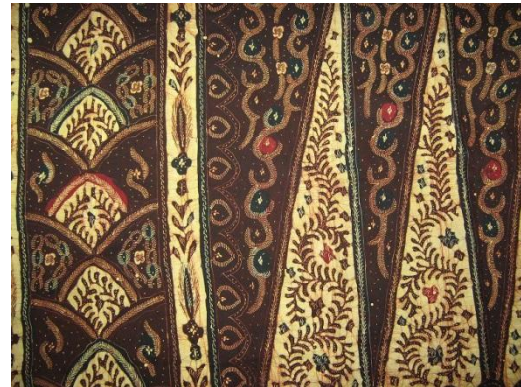
Gambar 7. Batik Gentongan Tanjung Bumi Madura

Salah satu jenis batik Tanjung Bumi Madura dibuat dengan teknik khusus yaitu batik gentongan .