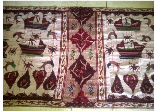
Gambar 6. Batik Tanjung Bumi motif Tasek Melaya (Sumber : koleksi pribadi, foto : Sekartaji, 2014)

Seni batik tulis yang menjadi batik khas Madura ini biasanya dikerjakan oleh para perempuan istri seorang nelayan yang disetiap goresannya memaknakan kesetiaan sang istri terhadap suaminya.