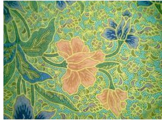
Gambar 4. Motif buketan pada batik Tanjung Bumi Madura

Pada era tahun 1910an, badan sarung batik Madura bermotif buketan kebanyakan berlatar warna krem, sebab pada masa itu masih banyak wanita keturunan Belanda, bahkan juga wanita-wanita Belanda totok yang menyukai warna lembut. Meskipun begitu, buketan dengan warna-warna cerah seperti merah, biru dan hijau juga sudah ada dan disukai oleh orang-orang lokal (penduduk asli Madura). Sekitar tahun 1930an, wanita Belanda yang memakai sarung berkurang. Selera kaum wanita keturunan Cina yang umumnya menyukai warna yang cerah, mempengaruhi warna batik masa itu. Selain warna yang berubah, motif tanaman digantikan dengan motif bunga potong yang disusun dalam bentuk buket.