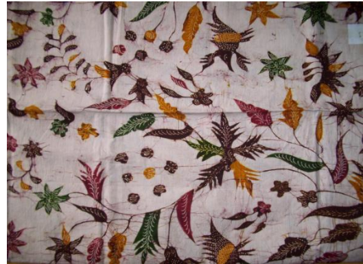
Gambar 3. Batik Gentongan Tanjung Bumi Madura motif bunga Tar Potehan (latar putih)