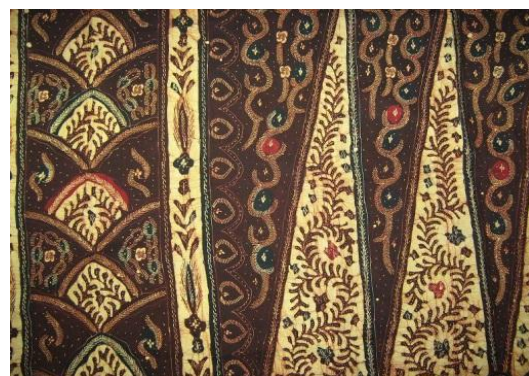
Gambar 4. Motif Pusung atau Pucuk Rebung pada batik Tanjung Bumi Madura

Hal ini dapat dilihat, misalnya dari bentuk kepala kain batik Madura yang umumnya bercorak pusung atau biasa juga disebut pucuk rebung, yaitu ragam hias berupa deretan segitiga sama kaki. Pusung menunjukkan pengaruh kain patola dan kain sembagi dari Pantai Koromandel, India.