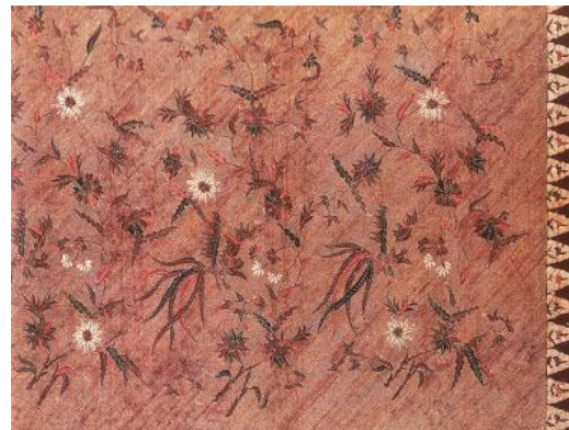
Gambar 1. Batik Bangkalan Madura dengan motif bunga

4. Sumenep : batik dengan corak satu warna saja meskipun tetap bernuansa cerah. Batik Madura terkenal dengan warna dan motif naturalis. Warna utamanya adalah merah, merah tua atau jingga, biru tua, hijau tua, hitam dan putih. Pengerjaan batik Madura tidak sehalus batik Jawa, tata warnanya sangat menyolok, begitu juga motifnya, yang juga besar, tegas. Hal ini sejalan dengan alam Madura yang keras dan watak orang Madura yang berani dan tegas.