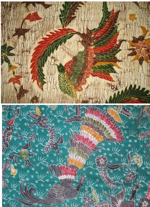
Gambar 5. Motif burung hong batik Bangkalan, Madura

Bulu ekornya berwarna hitam, putih, merah, hijau dan kuning, yang melambangkan kemurahan hati, kemanusiaan, kejujuran dan ketelitian, tenggang rasa, pengetahuan, kesetiaan dan integritas. Namun dalam perkembangan seni batik pesisir, khususnya batik Madura, warna bulu ekor ini bisa menjadi warna apa saja.