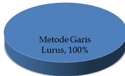
Gambar 3. Aktiva Tetap

pokok produksi pertambangan, perusahaan mengeluarkan harga pokok yang pertama kali terbentuk untuk dipasarkan pada masyarakat. Selain itu metode FIFO merupakan pengembangan dari metode identifikasi khusus manakala metode identifikasi khusus sulit diterapkan di dalam praktek.