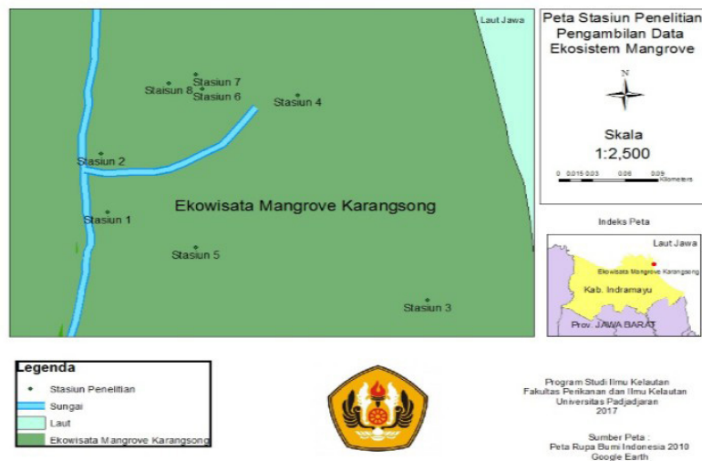
Gambar 1. Peta Stasiun Penelitian di Kawasan Wisata Mangrove Karangsong. Figure 1. Map of the research station in the tourist area of Mangrove Karangsong.

Pantai Karangsong terletak disebelah utara Kota Indramayu, berada di Kecamatan Indramayu, Desa Karangsong. Pantai Karangsong ini memiliki daerah konservasi hutan mangrove yang cukup luas kurang lebih 25 Ha. Pada tahun 2008 sampai 2014 dilakukan penanaman pohon bakau di Karangsong oleh pemerintah daerah dan perusahaan yang ada disekitar kawasan. Kemudian kawasan ini dibuka untuk umum untuk wisata bahari.