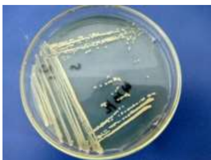
Gambar 1. Cara peremajaan bakteri E. coli transforman DH 5 \alpha dengan menggosok bakteri ke media LB padat dengan penambahan antibiotik

Kegiatan ini diawali dengan melakukan peremajaan bakteri, karena bakteri yang digunakan masih bersifat inaktif yang tersimpan dalam lemari pendingin. Cara peremajaan bakteri E. coli transforman DH 5 \alpha dengan menggosok bakteri ke media LB padat dengan penambahan antibiotik.