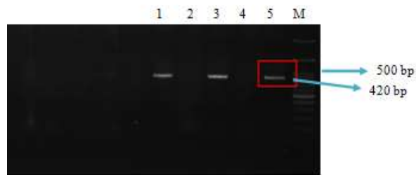
Gambar 3 : Foto hasil elektroforesis gel agarosa pada isolat DNA hasil isolasi plasmid.

Deteksi fragmen sisipan di dalam plasmid dilakukan menggunakan teknik PCR. Tahapan PCR lanjutan terdiri dari denaturasi awal 94 °C selama 5 menit, denaturasi 95°C selama 30 detik, annealing 54°C selama 30 detik, ekstensi 72 °C selama 1 menit diakhiri dengan ekstensi akhir 72 °C selama 10 menit. Produk PCR dielektroforesis untuk visualisasi deteksi gen sisipan E7 HPV 16.