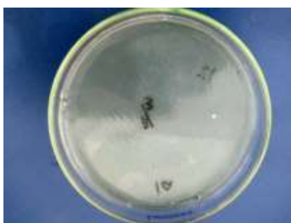
Gambar 2. Hasil ligasi kemudian di transformasikan ke dalam E. coli BL21

Setelah itu dilanjutkan pada proses ligasi yang dilakukan menggunakan KIT Thermo®.